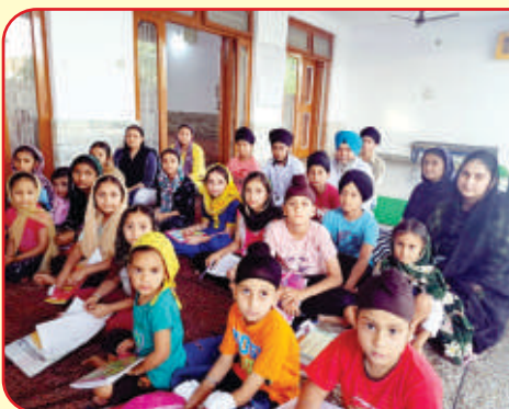
ਕੇਂਦਰ ਜੰਮੂ ਦੇ ਗੁਰਦੁਆਰਾ ਸਾਹਿਬ ਮਮਕਾ ਆਰ.ਐਸ.ਪੁਰਾ ਵਿਖੇ ਲੱਗ ਰਹੀ ਬੱਚਿਆਂ ਦੀ ਗੁਰਮਤਿ ਕਲਾਸ