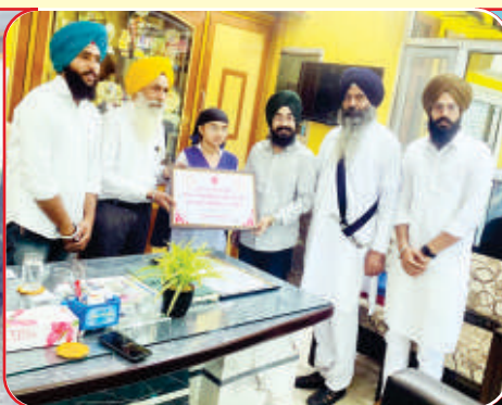
ਕੇਂਦਰ ਲਤਾਲਾ ਗੁਰੂ ਨਾਨਕ ਪਬਲਿਕ ਸਕੂਲ ਵਿਖੇ ਗੁਰਮਤਿ ਕੈਂਪ ਲਗਾਇਆ ਗਿਆ, ਬੱਚਿਆਂ ਸਨਮਾਨਤ ਵੀ ਕੀਤਾ ਗਿਆ।