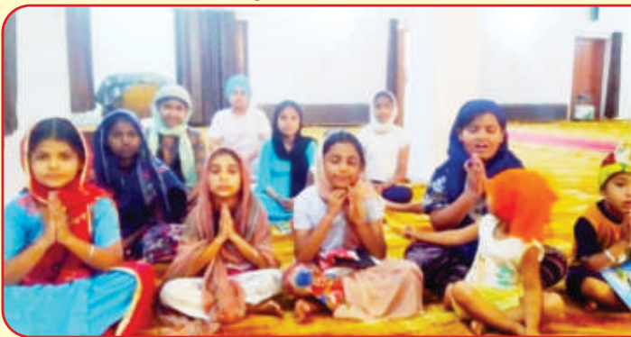
ਕੇਂਦਰ ਕੁੱਬਾ ਦੇ ਵੱਖ-ਵੱਖ ਪਿੰਡਾਂ ਵਿਚ ਗੁਰਮਤਿ ਕਲਾਸਾਂ ਲਗਾਈਆਂ ਜਾ ਰਹੀਆਂ ਹਨ।