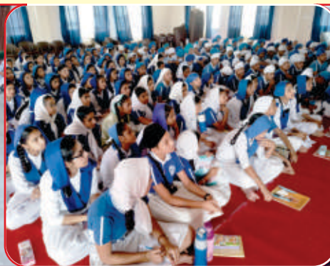
ਗੁਰੂ ਹਰਿਕ੍ਰਿਸ਼ਨ ਪਬਲਿਕ ਸਕੂਲ ਸੁਰਸਿੰਘ ਵਿਖੇ ਛੋਟੇ ਘੱਲੂਘਾਰੇ ਬਾਰੇ ਵਿਚਾਰਾਂ ਸਾਂਝੀਆਂ ਕੀਤੀਆਂ ਗਈਆਂ।