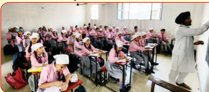
ਕੇਂਦਰ ਮਹਾਸਿੰਘਨਗਰ ਦੇ ਸਾਈਂ ਪਬਲਿਕ ਸਕੂਲ ਵਿਖੇ ਤਿੰਨ ਰੋਜ਼ਾ ਬੱਚਿਆਂ ਦਾ ਗੁਰਮਤਿ ਕੈਂਪ ਲਗਾਇਆ ਗਿਆ (ਸੱਜੇ) ਕੈਂਪ ਲਗਾਉਣ ਵਾਲੀ ਸਮੁੱਚੀ ਟੀਮ