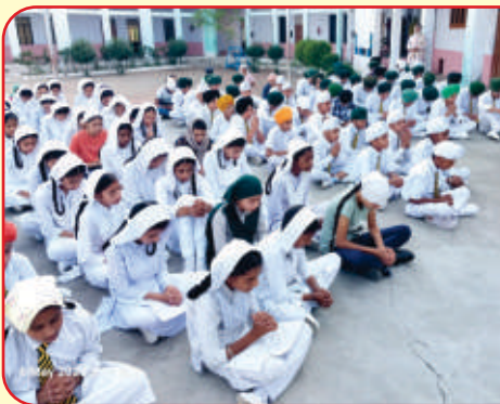
ਸ਼ਿਵਾਲਿਕ ਪਬਲਿਕ ਸਕੂਲ ਪੰਜਵੜ (ਤਰਨਤਾਰਨ) ਵਿਖੇ ਪੰਜ ਰੋਜ਼ਾ ਬੱਚਿਆਂ ਦਾ ਗੁਰਮਤਿ ਕੈਂਪ ਲਗਾਇਆ ਗਿਆ।