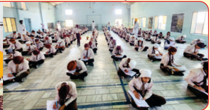
ਗੁਰੂ ਨਾਨਕ ਪਬਲਿਕ ਸਕੂਲ ਬਿਲਾਸਪੁਰ (ਨਿਹਾਲਸਿੰਘਵਾਲਾ) ਵਿਖੇ ਲੱਗੇ ਗੁਰਮਤਿ ਕੈਂਪ ਦੌਰਾਨ ਬੱਚਿਆਂ ਦਾ ਧਾਰਮਿਕ ਪੇਪਰ ਲਿਆ ਗਿਆ।