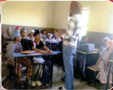
ਕੇਂਦਰ ਚੋਹਲਾ ਸਾਹਿਬ ਦੇ ਨਿਊ ਲਾਈਫ ਸਕੂਲ ਵਿਖੇ ਲੱਗ ਰਹੀ ਬੱਚਿਆਂ ਦੀ ਗੁਰਮਤਿ ਕਲਾਸ।