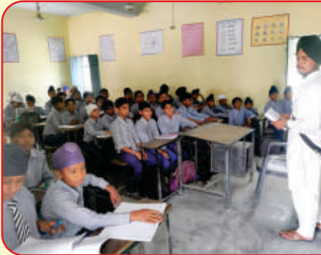
ਕੇਂਦਰ ਖਾਲੜਾ ਦੇ ਸਹਿਯੋਗ ਸਦਕਾ ਸਰਕਾਰੀ ਸਕੂਲ ਵਿਖੇ ਲੱਗ ਰਹੀ ਬੱਚਿਆਂ ਦੀ ਗੁਰਮਤਿ ਕਲਾਸ