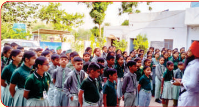
ਕੇਂਦਰ ਨਵਾਂਸ਼ਹਿਰ ਦੇ ਜੈ ਭਾਰਤ ਮਾਡਲ ਸਕੂਲ ਸਮੁੰਦੜਾ ਵਿਖੇ 6 ਰੋਜ਼ਾ ਗੁਰਮਤਿ ਕੈਂਪ ਲਗਾਇਆ ਗਿਆ, ਕੇਂਦਰ ਚੱਕ ਸਿੰਘਾ ਤੇ ਗੜ੍ਹਸ਼ੰਕਰ ਦੇ ਵੀਰਾਂ ਨੇ ਵੀ ਸਹਿਯੋਗ ਕੀਤਾ।