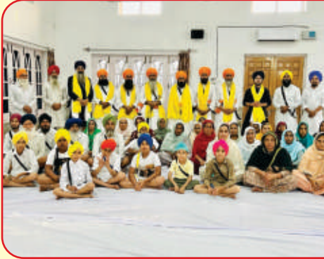
ਕੇਂਦਰ ਬੁਗਰਾ ਵਿਖੇ 37 ਪ੍ਰਾਣੀ ਖੰਡੇ ਬਾਟੇ ਦੀ ਪਹੁਲ ਲੈ ਕੇ ਗੁਰੂ ਵਾਲੇ ਬਣੇ