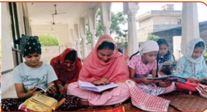
ਕੇਂਦਰ ਰਤਨਗੜ੍ਹ ਸਿੰਧੜਾਂ ਦੇ ਪਿੰਡ ਮੁਨਸ਼ੀਵਾਲਾ ਵਿਖੇ ਲੱਗ ਰਹੀ ਬੱਚਿਆਂ ਦੀ ਗੁਰਮਤਿ ਕਲਾਸ।