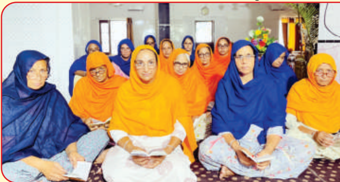
ਕੇਂਦਰ ਖਨਾਲ ਖੁਰਦ ਦੇ ਪਿੰਡ ਘਨੌੜ ਵਿਖੇ ਮਾਤਾਵਾਂ ਦੀ ਲੱਗ ਰਹੀ ਗੁਰਮਤਿ ਕਲਾਸ