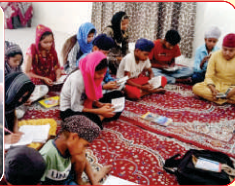
ਕੇਂਦਰ ਤਰਨਤਾਰਨ ਦੇ ਪਿੰਡ ਪਲਾਸੌਰ ਵਿਖੇ ਲੱਗ ਰਹੀ ਬੱਚਿਆਂ ਦੀ ਗੁਰਮਤਿ ਕਲਾਸ।