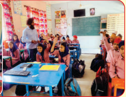
ਕੇਂਦਰ ਲਤਾਲਾ ਦੇ ਸਰਕਾਰੀ ਹਾਈ ਸਕੂਲ ਰੰਗੁਵਾਲ ਵਿਖੇ ਵਿਸ਼ਵ ਰੈੱਡ ਕਰਾਸ ਦਿਵਸ ਮਨਾਇਆ ਗਿਆ