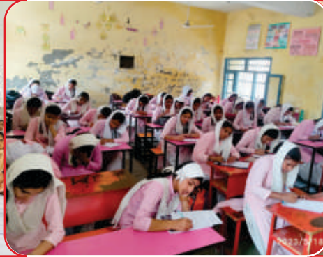
ਕੇਂਦਰ ਖਾਲੜਾ ਦੇ ਸਕੂਲ ਵਿਖੇ ਲੱਗ ਰਹੀ ਬੱਚਿਆਂ ਦੀ ਗੁਰਮਤਿ ਕਲਾਸ