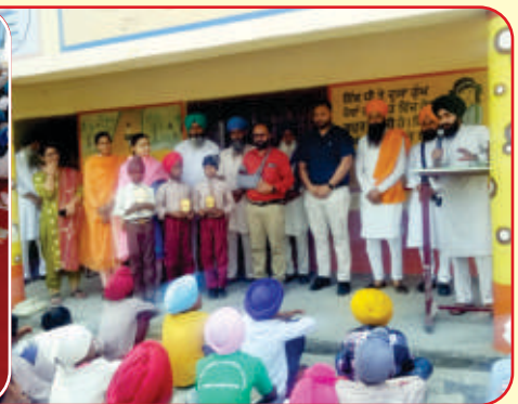
ਸਰਕਾਰੀ ਐਲੀਮੈਂਟਰੀ ਸਕੂਲ ਤਰਨਤਾਰਨ ਵਿਖੇ ਪੰਜ ਰੋਜ਼ਾ ਕੈਂਪ ਉਪਰੰਤ ਬੱਚਿਆਂ ਨੂੰ ਸਨਮਾਨਤ ਕੀਤਾ ਗਿਆ।