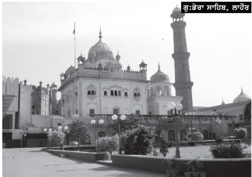
ਗੁ:ਭੇਰਾ ਸਾਹਿਬ, ਲਾਹੌਰ

ਸਿੱਖ ਧਰਮ ਦੀ ਅਸਲ ਨੀਂਹ ਮਹਾਨ ਪੁਰਖਾਂ ਦੁਆਰਾ ਬਖਸ਼ੀ ਹੋਈ ਵਿਚਾਰਧਾਰਾ ਹੈ ਜੋ ਗੁਰਬਾਣੀ ਵਿਚੋਂ ਜ਼ਾਹਰ ਹੁੰਦੀ ਹੈ। ਗੁਰੂ ਨਾਨਕ ਸਾਹਿਬ ਜੀ ਨੇ ਆਪਣੀ ਬਾਣੀ ਨਾਲ ਭਗਤ ਸਾਹਿਬਾਨਾਂ ਦੀ ਬਾਣੀ ਇਕੱਤਰ ਕਰਕੇ ਇੱਕ ਮਹਾਨ ਪਰਉਪਕਾਰ ਕੀਤਾ ਸੀ। ਗੁਰੂ ਅਰਜਨ ਸਾਹਿਬ ਜੀ ਨੇ ਗੁਰੂਆਂ ਦੀ ਅਤੇ ਬਾਕੀ ਮਹਾਪੁਰਖਾਂ ਦੀ ਬਾਣੀ ਦਾ ਇੱਕ ਥਾਂਵੇਂ ਸੰਪਾਦਨ ਕਰਕੇ ਇੱਕ ਮਹਾਨ ਤੇ ਲਾਸਾਨੀ ਕਾਰਜ ਕੀਤਾ। ਅਜਿਹਾ ਕਰਨ ਨਾਲ ਸਿੱਖ ਵਿਚਾਰਧਾਰਾ ਪੱਕੇ ਪੈਰੀ ਸਥਾਪਤ ਹੋ ਗਈ, ਸਭ ਲੋਕ ਇਸ ਨੂੰ ਰੱਬੀ ਗਿਆਨ ਸਮਝ ਕੇ ਸਤਿਕਾਰ ਕਰਨ ਲੱਗੇ।