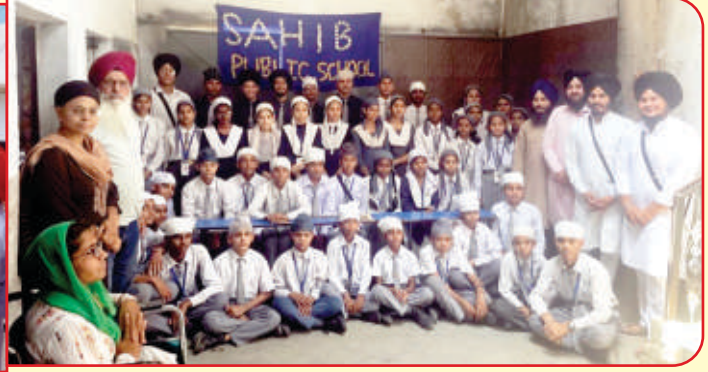
ਕੇਂਦਰ ਲੁਧਿਆਣਾ ਦੇ ਸਾਹਿਬ ਪਬਲਿਕ ਸਕੂਲ ਵਿਖੇ ਗੁਰਮਤਿ ਕੈਂਪ ਲਗਾਇਆ ਗਿਆ