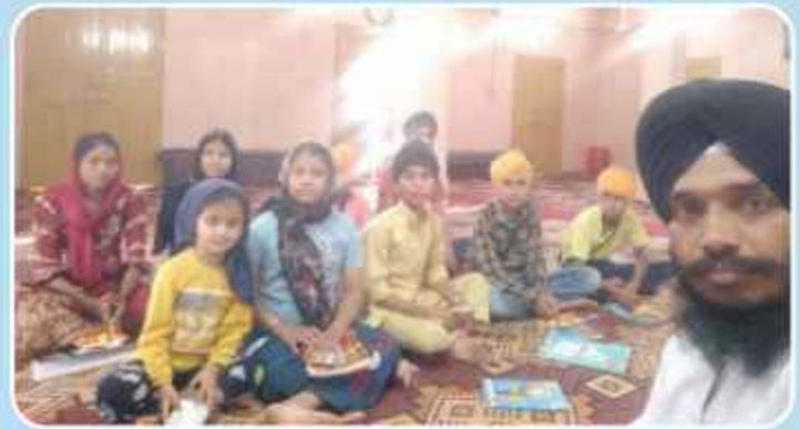
ਕੇਂਦਰ ਕੁੱਥਾ ਦੇ ਪਿੰਡ ਉੱਪਲ ਵਿਖੇ ਲੱਗ ਰਹੀ ਬੱਚਿਆਂ ਦੀ ਗੁਰਮਤਿ ਕਲਾਸ