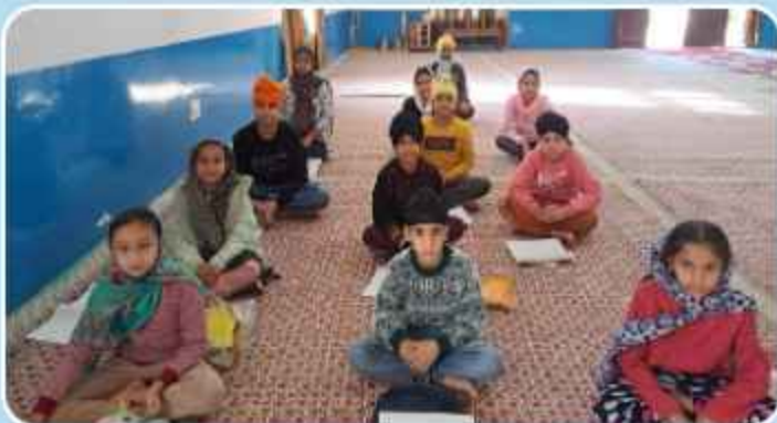
ਕੇਂਦਰ ਜੰਮੂ ਦੇ ਗੁ: ਸਿੰਘ ਪੁਰਾ ਮੁਰਾਲੀਆਂ ਵਿਖੇ ਲੱਗ ਰਹੀ ਬੱਚਿਆਂ ਦੀ ਧਾਰਮਿਕ ਕਲਾਸ