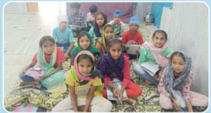
ਕੇਂਦਰ ਡੱਲ ਦੇ ਪਿੰਡ ਵੀਰਮ ਵਿਖੇ ਲੱਗ ਰਹੀ ਬੱਚਿਆਂ ਦੀ ਗੁਰਮਤਿ ਕਲਾਸ