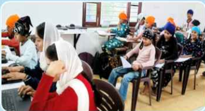
ਕੇਂਦਰ ਨਵਾਂਬਹਿਰ ਵਿਖੇ ਬੱਚਿਆਂ ਦੀ ਲੱਗ ਰਹੀ ਫ੍ਰੀ ਕੰਪਿਊਟਰ ਕਲਾਸ