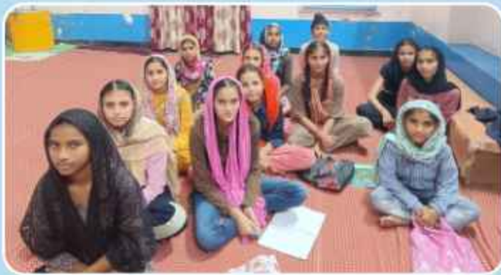
ਕੇਂਦਰ ਡੱਲ ਦੇ ਪਿੰਡ ਖਾਲਤਾ ਵਿਖੇ ਲੱਗ ਰਹੀ ਬੱਚਿਆਂ ਦੀ ਗੁਰਮਤਿ ਕਲਾਸ