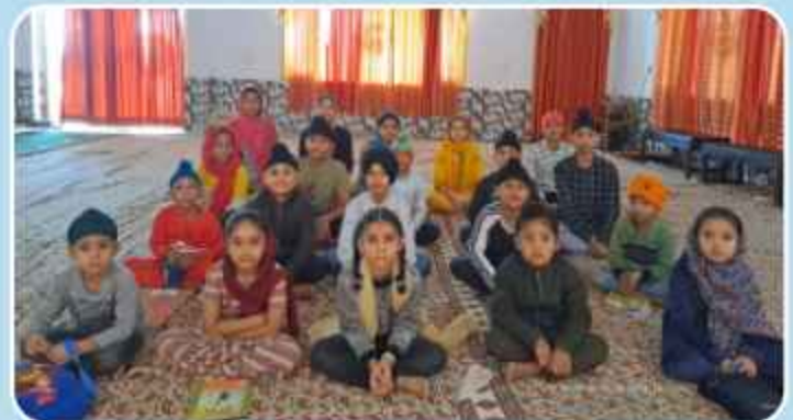
ਕੇਂਦਰ ਜੰਮੂ ਦੇ ਗੁ: ਬਾਬਾ ਬੰਦਾ ਸਿੰਘ ਬਹਾਦਰ ਵਿਖੇ ਲੱਗ ਰਹੀ ਬੱਚਿਆਂ ਦੀ ਧਾਰਮਿਕ ਕਲਾਸ