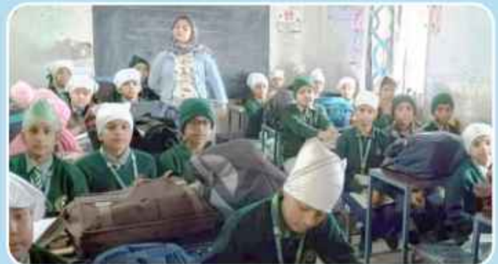
ਕੇਂਦਰ ਨਵਾਂਬਹਿਰ ਦੇ ਜੈ ਭਾਰਤ ਪਬਲਿਕ ਸਕੂਲ ਸਮੁੰਦਰਾ ਵਿਖੇ ਲੱਗ ਰਹੀ ਗੁਰਮਤਿ ਕਲਾਸ