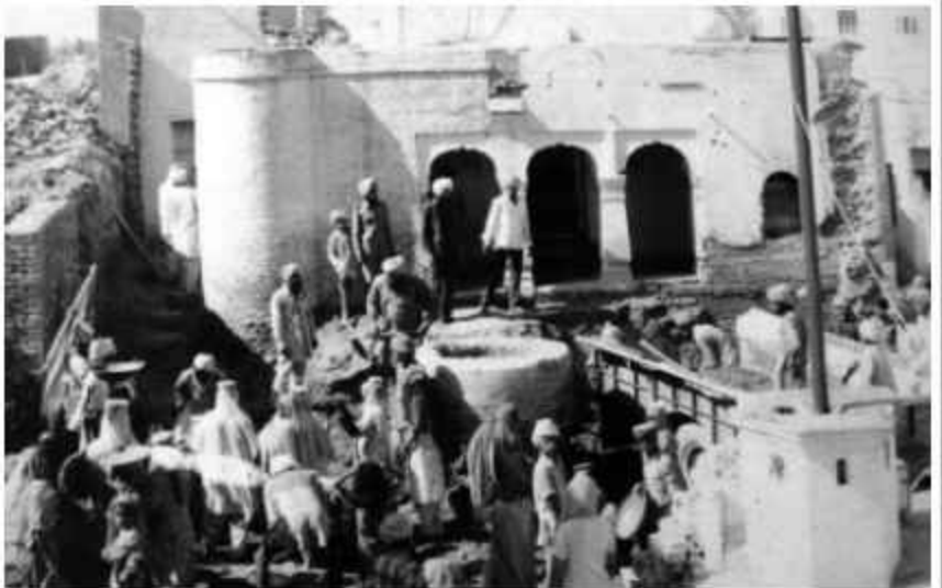
ਚਮਕੌਰ ਦੀ ਗੜ੍ਹੀ ਦੀ ਪੁਰਾਣੀ ਤਸਵੀਰ

ਸਰਸਾ ਨਦੀ ਨੂੰ ਪਾਰ ਕਰਦਿਆਂ ਹੀ ਗੁਰੂ ਪਰਿਵਾਰ ਵਿਚ ਵਿਛੋੜਾ ਪੈ ਗਿਆ। ਮਾਤਾ ਗੁਜਰੀ ਜੀ ਤੇ ਛੋਟੇ ਸਾਹਿਬਜ਼ਾਦੇ ਗੁਰੂ ਸਾਹਿਬ ਅਤੇ ਸਿੱਖਾਂ ਤੋਂ ਵੱਖ ਹੋ ਕੇ ਕਿਸੇ ਔਝੜੇ ਰਾਹ ਪੈ ਗਏ। ਇਧਰ ਗੁਰੂ ਗੋਬਿੰਦ ਸਿੰਘ ਜੀ ਆਪਣੇ ਵੱਡੇ ਦੋ ਫ਼ਰਜ਼ਦਾਂ ਅਤੇ 40 ਕੁ ਸਿੱਖਾਂ ਨੂੰ ਨਾਲ ਲੈ ਕੇ ਰੋਪੜ ਦੇ ਇਲਾਕੇ ਵਿਚ ਪਹੁੰਚ ਗਏ। ਇਸ ਇਲਾਕੇ ਵਿਚ ਆ ਕੇ ਪਾਤਸ਼ਾਹ ਆਉਣ ਵਾਲੇ ਸੰਕਟ (ਪਿੱਛਾ ਕਰ ਰਹੀਆਂ ਮੁਗ਼ਲ ਫ਼ੌਜਾਂ) ਦਾ ਸਾਹਮਣਾ ਕਰਨ ਦੀ ਵਿਉਂਤਬੰਦੀ ਕਰਨ ਲੱਗੇ।