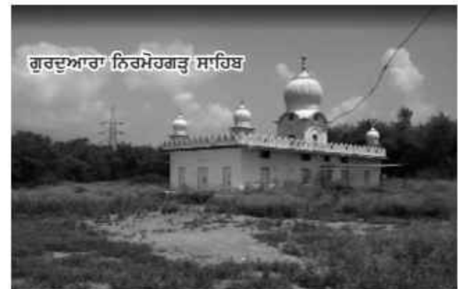
ਗੁਰਦੁਆਰਾ ਨਿਰਮੋਹਗੜ੍ਹ ਸਾਹਿਬ

• ਨਿਰਮੋਹਗੜ੍ਹ ਦਾ ਮੈਦਾਨ-ਏ-ਜੰਗ: ਕੀਰਤਪੁਰ ਸਾਹਿਬ ਦੇ ਨੇੜੇ ਪਿੰਡ ਨਿਰਮੋਹ ਦੀ ਇਸ ਰਣ ਭੂਮੀ ਵਿੱਚ ਇਹ ਲੜਾਈ 1701 ਈ: ਵਿੱਚ