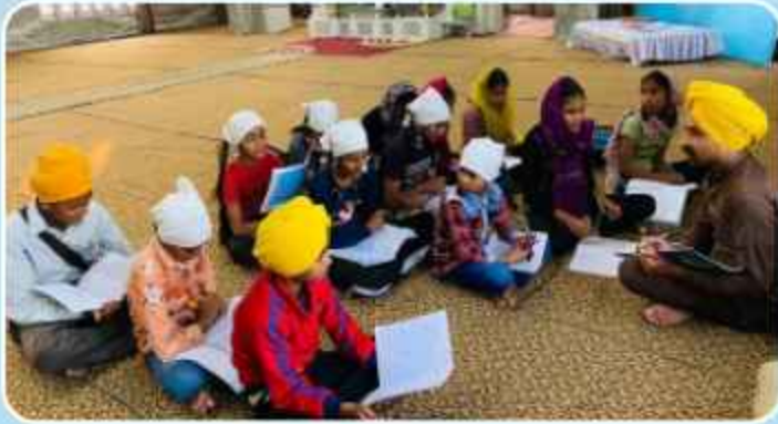
ਕੇਂਦਰ ਬੁਗਰਾ ਦੇ ਗੁਰਦੁਆਰਾ ਸਾਹਿਬ ਵਿਖੇ ਲੱਗ ਰਹੀ ਬੱਚਿਆਂ ਦੀ ਗੁਰਮਤਿ ਕਲਾਸ