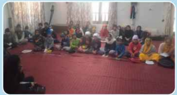
ਕੇਂਦਰ ਚੱਕ ਕਲਾਂ ਪਿੰਡ ਹੇਰਾਂ ਵਿਖੇ ਲੱਗ ਰਹੀਆਂ ਬੱਚਿਆਂ ਦੀ ਗੁਰਮਤਿ ਕਲਾਸ