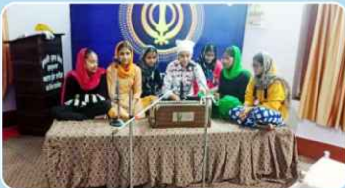
ਕੇਂਦਰ ਚੱਕ ਸਿੰਘਾ ਵਿਖੇ ਗੁਰਮਤਿ ਕਲਾਸ ਦੇ ਬੱਚੇ ਕੀਰਤਨ ਅਭਿਆਸ ਕਰਦੇ ਹੋਏ