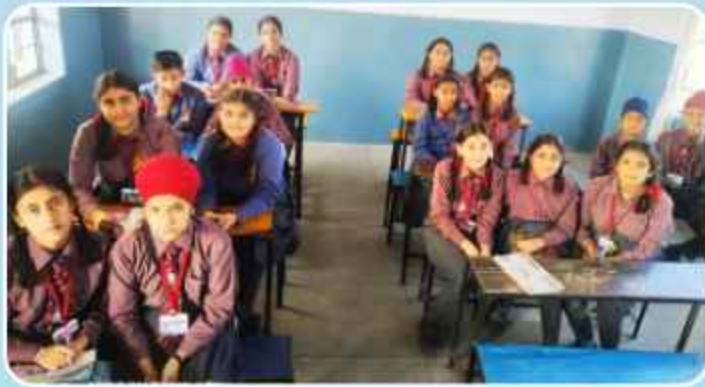
ਕੇਂਦਰ ਕੁੱਥਾ ਦੇ ਓਰੀਐਂਟਲ ਪਬਲਿਕ ਸਕੂਲ ਵਿਖੇ ਲੱਗ ਰਹੀ ਬੱਚਿਆਂ ਦੀ ਗੁਰਮਤਿ ਕਲਾਸ