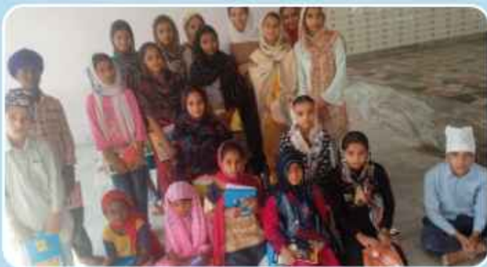
ਕੇਂਦਰ ਪਰਿੰਗੜੀ ਵਿਖੇ ਲੱਗ ਰਹੀ ਬੱਚਿਆਂ ਦੀ ਗੁਰਮਤਿ ਕਲਾਸ