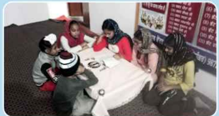
ਕੇਂਦਰ ਚੱਕ ਸਿੰਘਾ ਵਿਖੇ ਲੱਗ ਰਹੀ ਬੱਚਿਆਂ ਦੀ ਗੁਰਮਤਿ ਕਲਾਸ