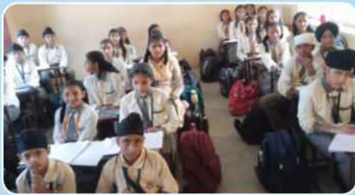
ਕੇਂਦਰ ਤਰਨਤਾਰਨ ਵਲੋਂ ਪਿੰਡ ਨੰਦਪੁਰ ਸਕੂਲ ਵਿਖੇ ਲੱਗ ਰਹੀਆਂ ਬੱਚਿਆਂ ਦੀ ਗੁਰਮਤਿ ਕਲਾਸ