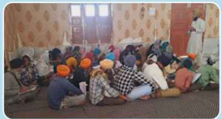
ਪਿੰਡ ਰੁੜੋਆਸਲ ਵਿਖੇ ਲੱਗ ਰਹੀ ਬੱਚਿਆਂ ਤੇ ਨੌਜਵਾਨਾਂ ਦੀ ਗੁਰਮਤਿ ਕਲਾਸ