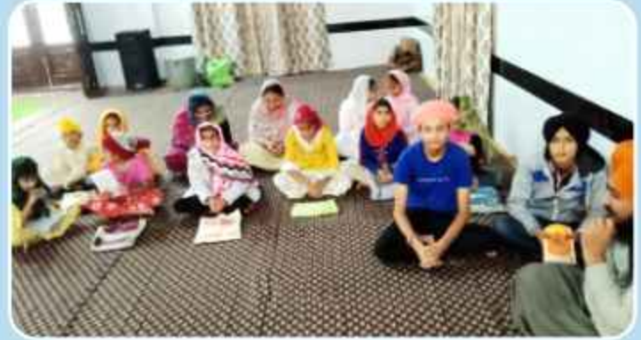
ਕੇਂਦਰ ਖਨਾਲ ਖੁਰਦ ਵਿਖੇ ਲੱਗ ਰਹੀ ਬੱਚਿਆਂ ਦੀ ਗੁਰਮਤਿ ਕਲਾਸ