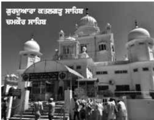
ਕੁਰਦੁਆਰਾ ਕਤਲਗੜ੍ਹ ਸਾਹਿਬ ਚਮਕੌਰ ਸਾਹਿਬ