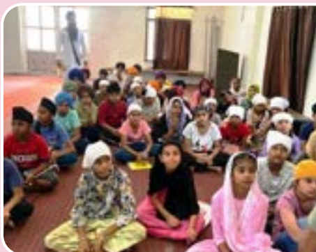
ਕੇਂਦਰ ਭਾਗੀਕੇ ਵਿਖੇ ਗੁਰਮਤਿ ਕੈਂਪ ਲਗਾਇਆ ਗਿਆ