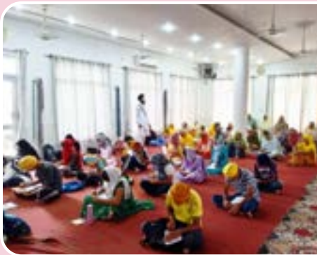
ਕੇਂਦਰ ਚੱਕ ਕਲਾਂ ਵਲੋਂ ਲਗਾਏ ਗੁਰਮਤਿ ਕੈਂਪ ਦੌਰਾਨ ਬੱਚਿਆਂ ਦਾ ਧਾਰਮਿਕ ਪੇਪਰ ਲਿਆ ਗਿਆ।