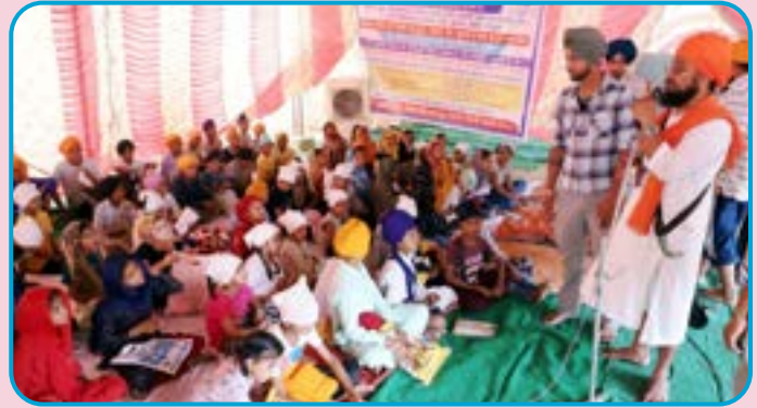
ਕੇਂਦਰ ਰਤਨਗੜ੍ਹ ਸਿੰਧੜਾਂ ਵਲੋਂ ਪਿੰਡ ਗੋਬਿੰਦਗੜ੍ਹ ਜੋਜੀਆਂ ਵਿਖੇ 9 ਤੋਂ 16 ਜੂਨ ਤਕ ਗੁਰਮਤਿ ਕੈਂਪ ਲਗਾਇਆ ਗਿਆ। ਵੱਡੀ ਗਿਣਤੀ ਵਿਚ ਬੱਚਿਆਂ ਨੇ ਹਾਜ਼ਰੀ ਭਰੀ।