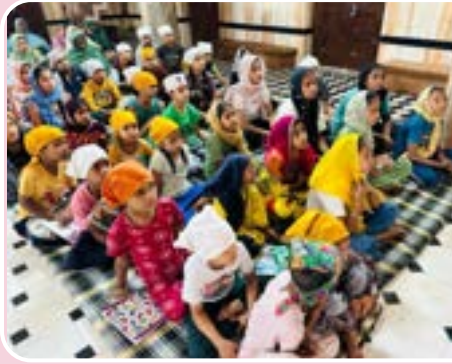
ਕੇਂਦਰ ਖਨਾਲ ਖੁਰਦ ਵਲੋਂ ਪਿੰਡ ਦੁਗਾਲ (ਪਟਿਆਲਾ) ਵਿਖੇ 3 ਤੋਂ 8 ਜੂਨ ਤਕ ਗੁਰਮਤਿ ਕੈਂਪ ਲਗਾਇਆ ਗਿਆ। ਜਿਸ ਵਿਚ ਕਈ ਪਿੰਡਾਂ ਦੇ ਬੱਚਿਆਂ ਨੇ ਹਿੱਸਾ ਲਿਆ।