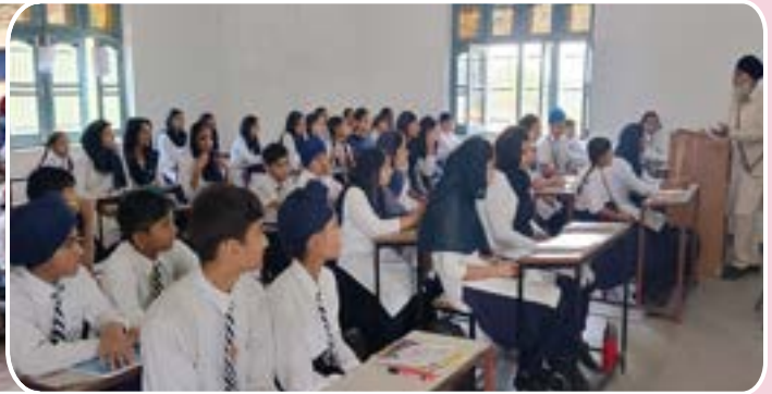
ਕੇਂਦਰ ਨਵਾਂਸ਼ਹਿਰ ਵਲੋਂ ਪਿੰਡ ਮਜਾਰੀ ਦੇ ਗੁਰੂ ਨਾਨਕ ਬੱਬਰ ਅਕਾਲੀ ਮੈਮੋਰੀਅਲ ਸਕੂਲ ਵਿਖੇ ਗੁਰਮਤਿ ਕੈਂਪ ਲਗਾਇਆ ਗਿਆ।