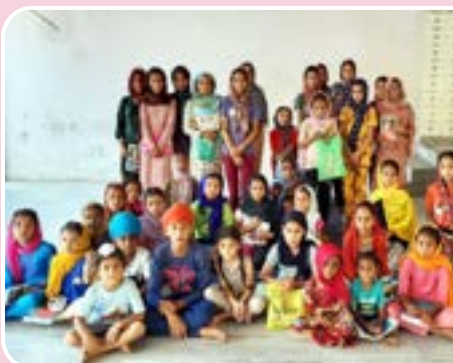
ਕੇਂਦਰ ਪਰਿੰਗੜੀ ਵਿਖੇ ਲੱਗ ਰਹੀ ਬੱਚਿਆਂ ਦੀ ਗੁਰਮਤਿ ਕਲਾਸ