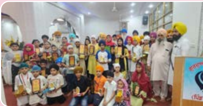
ਕੇਂਦਰ ਚੱਕ ਕਲਾਂ ਵਿਖੇ ਗਰਮੀਆਂ ਦੀ ਛੁੱਟੀਆਂ ਦੌਰਾਨ ਗੁਰਦੁਆਰਾ ਸਿੰਘ ਸਭਾ ਵਿਚ ਗੁਰਮਤਿ ਕੈਂਪ ਲਗਾਇਆ ਗਿਆ। ਜਿਸ ਵਿਚ ਵੱਡੀ ਗਿਣਤੀ ਵਿਚ ਬੱਚਿਆਂ ਵਲੋਂ ਸ਼ਮੂਲੀਅਤ ਕੀਤੀ ਗਈ। ਉਪਰੰਤ ਬੱਚਿਆਂ ਨੂੰ ਸ਼ੀਲਡਾਂ ਵੰਡ ਕੇ ਸਨਮਾਨਤ ਕੀਤਾ ਗਿਆ