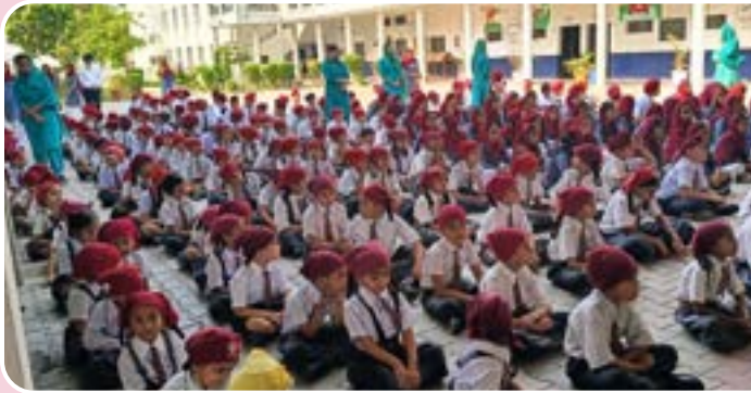
ਕੇਂਦਰ ਨਵਾਂਸ਼ਹਿਰ ਵਲੋਂ ਪਿੰਡ ਦੌਲਤਪੁਰ ਦੇ ਬੱਬਰ ਕਰਮ ਸਿੰਘ ਮੈਮੋਰੀਅਲ ਸਕੂਲ ਵਿਖੇ ਗੁਰਮਤਿ ਕੈਂਪ ਲਗਾਇਆ ਗਿਆ।