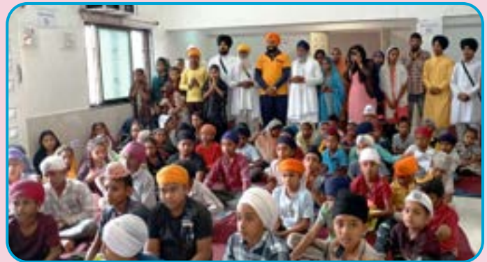
ਪਿੰਡ ਉਮਰਟੀ ਜ਼ਿਲ੍ਹਾ ਬੜਵਾਨੀ (ਮੱਧ ਪ੍ਰਦੇਸ਼) ਵਿਚ ਬੱਚਿਆਂ ਦਾ ਗੁਰਮਤਿ ਸਿਖਲਾਈ ਕੈਂਪ ਲਾਇਆ ਗਿਆ।