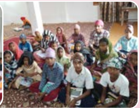
ਕੇਂਦਰ ਮਾਲੂਵਾਲ ਵਿਖੇ ਲੱਗ ਰਹੀ ਬੱਚਿਆਂ ਦੀ ਗੁਰਮਤਿ ਕਲਾਸ