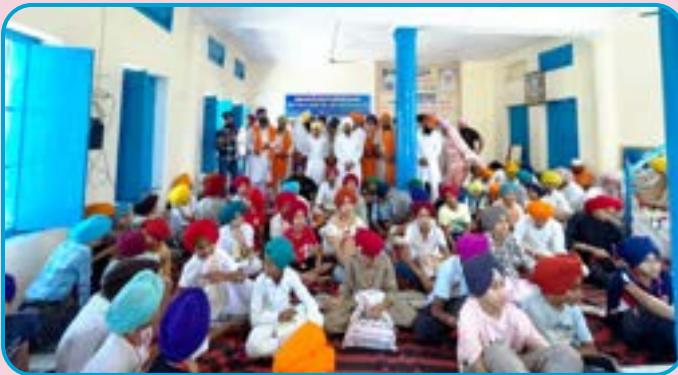
ਕੇਂਦਰ ਲਤਾਲਾ ਦੇ ਪਿੰਡ ਬੜੂੰਦੀ ਵਿਖੇ ਗੁਰੂ ਅਰਜਨ ਸਾਹਿਬ ਜੀ ਦੇ ਸ਼ਹੀਦੀ ਪੁਰਬ ਮੌਕੇ ਸੁੰਦਰ ਦਸਤਾਰ ਮੁਕਾਬਲੇ ਕਰਵਾਏ ਗਏ।