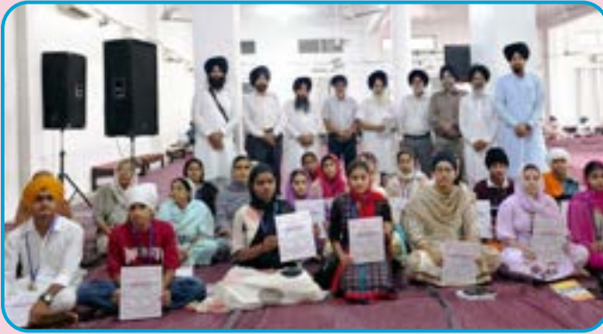
ਗੁਰਦੁਆਰਾ ਸਾਹਿਬ ਭਾਈ ਜਗਤਾ ਜੀ (ਬਠਿੰਡਾ) ਵਿਖੇ ਗੁਰਮਤਿ ਕੈਂਪ ਲਗਾਇਆ ਗਿਆ। ਉਪਰੰਤ ਬੱਚਿਆਂ ਨੂੰ ਮੈਡਲ ਤੇ ਸਰਟੀਫਿਕੇਟ ਵੰਡੇ ਗਏ।