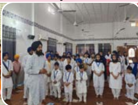
ਪਿੰਡ ਜੰਗਪੁਰਾ (ਮੁਹਾਲੀ) ਵਿਖੇ ਗੁਰਮਤਿ ਕੈਂਪ ਦੀ ਆਰੰਭਤਾ