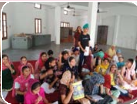
ਪਿੰਡ ਚਾਨੀਆ (ਕੇਂਦਰ ਚੱਕ ਕਲਾਂ) ਵਿਖੇ ਲੱਗਾ ਬੱਚਿਆਂ ਦਾ ਗੁਰਮਤਿ ਕੈਂਪ