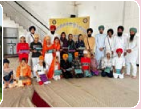
ਕੇਂਦਰ ਅੱਪਰਾ ਵਲੋਂ ਪਿੰਡ ਹੁਸੈਣਪੁਰਾ (ਲੁਧਿਆਣਾ) ਵਿਖੇ ਗੁਰਮਤਿ ਕੈਂਪ ਲਗਾਇਆ ਗਿਆ