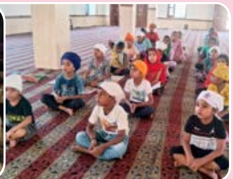
ਕੇਂਦਰ ਵਜੀਦ ਕੇ ਖੁਰਦ ਵਿਖੇ ਲੱਗ ਰਹੀ ਗੁਰਮਤਿ ਕਲਾਸ।