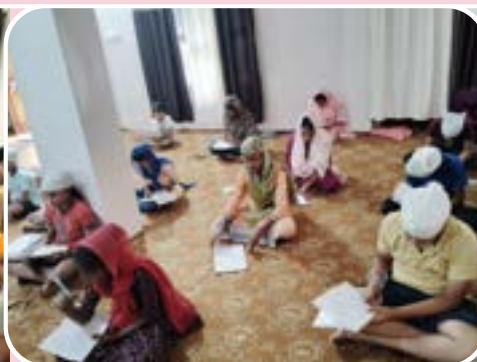
ਕੇਂਦਰ ਕੁੱਬਾ ਦੇ ਪਿੰਡ ਊਰਨਾ ਵਿਖੇ ਲੱਗਾ ਗੁਰਮਤਿ ਕੈਂਪ