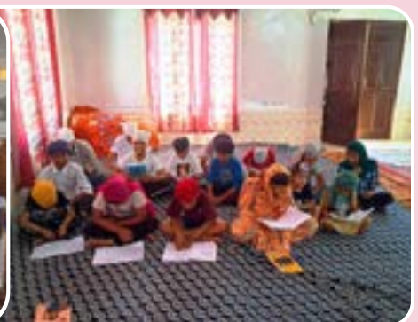
ਪਿੰਡ ਜੋਟੋਕੇ ਵਿਖੇ ਲੱਗ ਰਹੀ ਬੱਚਿਆਂ ਦੀ ਗੁਰਮਤਿ ਕਲਾਸ