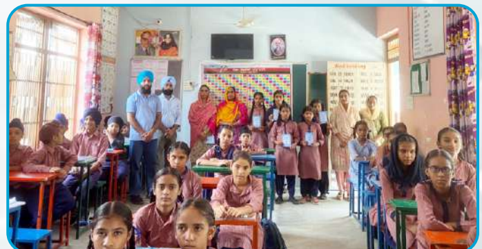
ਕੇਂਦਰ ਲਤਾਲਾ ਦੇ ਮਿਡਲ ਸਕੂਲ ਰਾਜਗੜ੍ਹ ਵਿਖੇ ਵਿਦਿਆਰਥੀਆਂ ਦੀ ਨੈਤਿਕ ਸਿੱਖਿਆ ਕਲਾਸ ਲਗਾਈ ਗਈ।