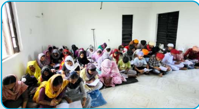
ਕੇਂਦਰ ਤਰਨਤਾਰਨ ਦੇ ਪਿੰਡ ਰੂੜੇਆਸਲ ਵਿਖੇ ਲੱਗ ਰਹੀ ਬੱਚਿਆਂ ਦੀ ਗੁਰਮਤਿ ਕਲਾਸ