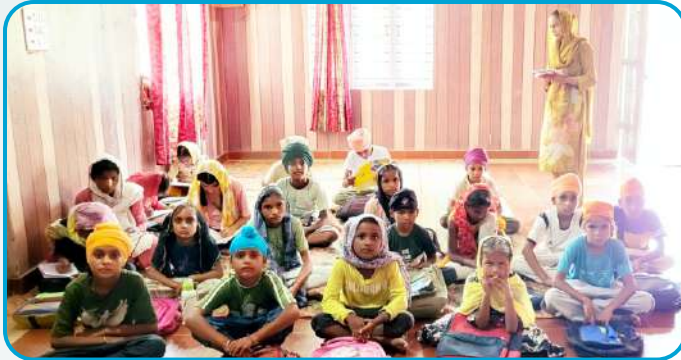
ਕੇਂਦਰ ਤਰਨਤਾਰਨ ਦੇ ਪਿੰਡ ਸੁਹਾਵਾ ਵਿਖੇ ਲੱਗ ਰਹੀ ਬੱਚਿਆਂ ਦੀ ਗੁਰਮਤਿ ਕਲਾਸ