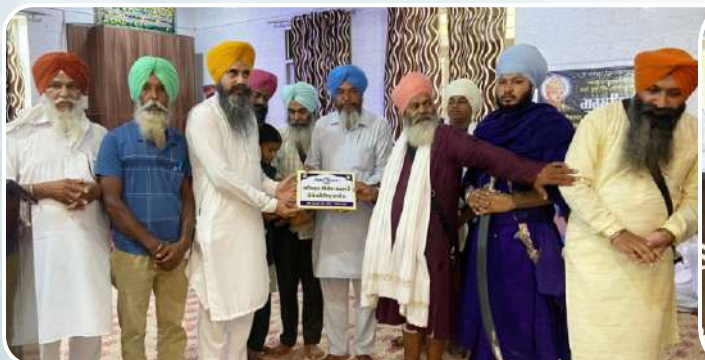
ਕੇਂਦਰ ਚੁਪਕੀਤੀ ਦੇ ਪਿੰਡ ਘੋਲੀਆਂ ਵਿਖੇ ਗੁਰਮਤਿ ਸਮਾਗਮ ਕਰਵਾਏ ਗਏ ਉਪਰੰਤ ਬੱਚਿਆਂ ਨੂੰ ਇਨਾਮਾਂ ਨਾਲ ਸਨਮਾਨਤ ਕੀਤਾ ਗਿਆ