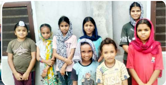
ਕੇਂਦਰ ਰਤਨਗੜ੍ਹ ਸਿੰਧੜਾ ਦੇ ਪਿੰਡ ਮੁਨਸ਼ੀਵਾਲਾ ਵਿਖੇ ਗੁਰਮਤਿ ਕਲਾਸ ਲਗਾਉਣ ਵਾਲੇ ਬੱਚੇ