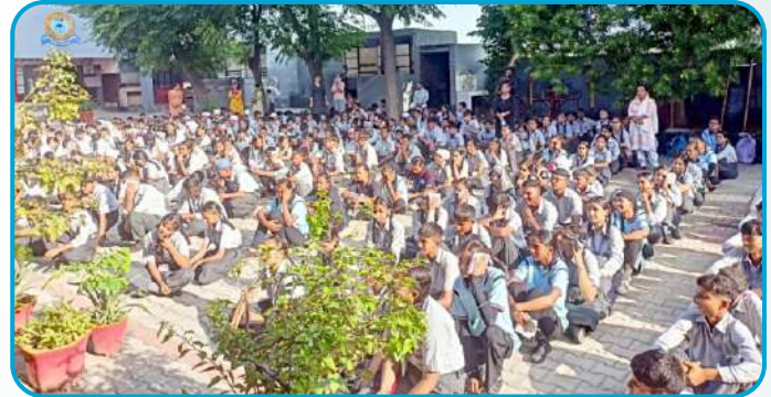
ਕੇਂਦਰ ਅੰਪਰਾ ਵਲੋਂ ਪੰਜਾਬ ਅਕੈਡਮੀ (ਬੜਾ ਪਿੰਡ) ਵਿਖੇ ਗੁਰਮਤਿ ਕਲਾਸਾਂ ਦੀ ਆਰੰਭਤਾ ਕੀਤੀ ਗਈ।