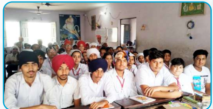
ਸੈਂਟ ਜੋਨ ਅਕੈਡਮੀ ਪਿੰਡ ਸ਼ੰਕਰ (ਚੱਕ ਕਲਾਂ ਕੇਂਦਰ) ਵਿਖੇ ਲੱਗ ਰਹੀ ਗੁਰਮਤਿ ਕਲਾਸ