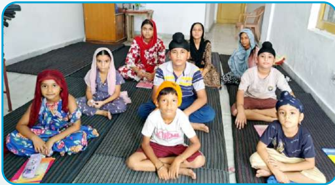
ਕੇਂਦਰ ਜੰਮੂ ਦੇ ਗੁਰਦੁਆਰਾ ਸਾਹਿਬ ਮਮਕਾ ਵਿਖੇ ਲੱਗ ਰਹੀ ਬੱਚਿਆਂ ਦੀ ਧਾਰਮਿਕ ਕਲਾਸ