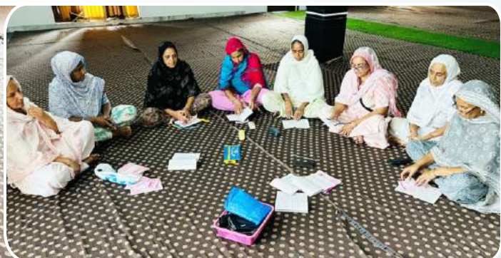
ਕੇਂਦਰ ਖਨਾਲ ਖੁਰਦ ਵਿਖੇ ਲੱਗ ਮਾਤਾਵਾਂ ਦੀ ਗੁਰਮਤਿ ਕਲਾਸ।