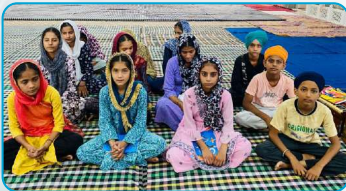
ਕੇਂਦਰ ਬੁਗਰਾ ਵਿਖੇ ਲੱਗ ਰਹੀ ਬੱਚਿਆਂ ਦੀ ਗੁਰਮਤਿ ਕਲਾਸ