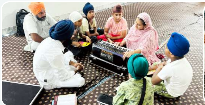
ਕੇਂਦਰ ਖਨਾਲ ਖੁਰਦ ਵਿਖੇ ਲੱਗ ਰਹੀ ਬੱਚਿਆਂ ਦੀ ਗੁਰਬਾਣੀ ਕੀਰਤਨ ਦੀ ਕਲਾਸ