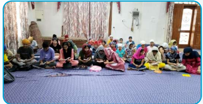
ਕੇਂਦਰ ਚੱਕ ਕਲਾਂ ਦੇ ਪਿੰਡ ਹੇਰਾਂ ਵਿਖੇ ਲੱਗ ਰਹੀ ਬੱਚਿਆਂ ਦੀ ਗੁਰਮਤਿ ਕਲਾਸ