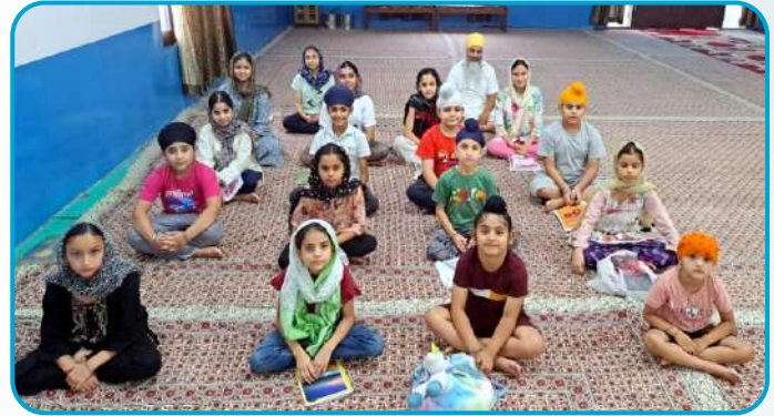
ਕੇਂਦਰ ਜੰਮੂ ਦੇ ਗੁਰਦੁਆਰਾ ਗੁਰੂ ਸਿੰਘ ਸਭਾ ਸਿੰਘਪੁਰਾ ਮੁਰਾਲੀਆਂ ਵਿਖੇ ਲੱਗ ਰਹੀ ਬੱਚਿਆਂ ਦੀ ਧਾਰਮਿਕ ਕਲਾਸ