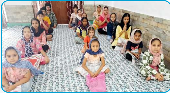
ਕੇਂਦਰ ਜੰਮੂ ਦੇ ਗੁਰਦੁਆਰਾ ਗੁਰੂ ਸਿੰਘ ਸਭਾ ਫਿੰਦੜ ਆਰ.ਐਸ.ਪੁਰਾ ਵਿਖੇ ਲੱਗ ਰਹੀ ਬੱਚਿਆਂ ਦੀ ਧਾਰਮਿਕ ਕਲਾਸ