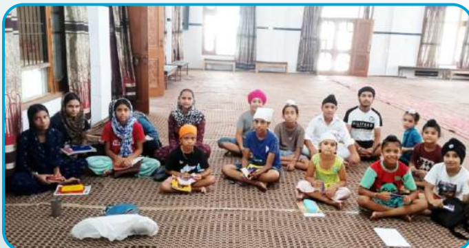
ਕੇਂਦਰ ਚੱਕ ਕਲਾਂ ਦੇ ਪਿੰਡ ਭੰਡਾਲ ਹਿੰਮਤ ਵਿਖੇ ਲੱਗ ਰਹੀ ਬੱਚਿਆਂ ਦੀ ਗੁਰਮਤਿ ਕਲਾਸ