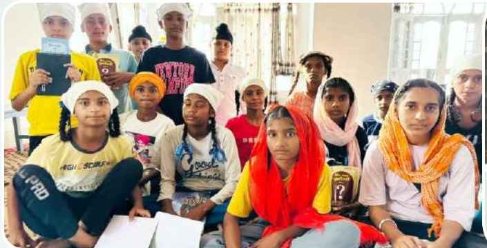
ਕੇਂਦਰ ਰਤਨਗੜ੍ਹ ਸਿੰਧੜਾ ਦੇ ਪਿੰਡ ਤੂਰਬਨਜਾਰਾ ਵਿਖੇ ਲੱਗ ਰਹੀ ਬੱਚਿਆਂ ਦੀ ਗੁਰਮਤਿ ਕਲਾਸ