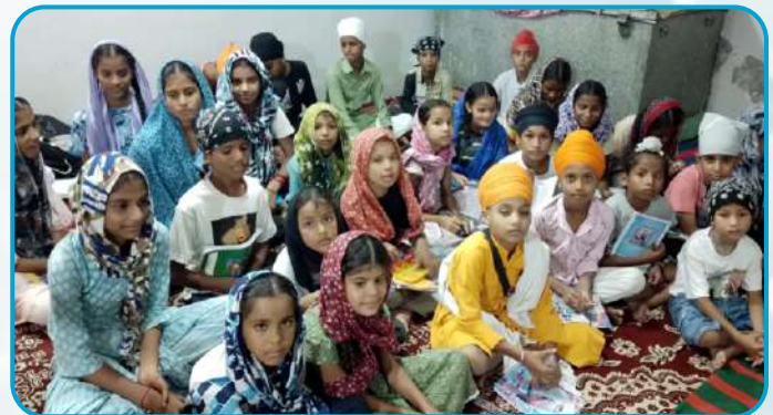
ਕੇਂਦਰ ਮਾਲੂਵਾਲ ਦੇ ਪਿੰਡ ਸੁਰਸਿੰਘ ਵਿਖੇ ਲੱਗ ਰਹੀ ਬੱਚਿਆਂ ਦੀ ਗੁਰਮਤਿ ਕਲਾਸ