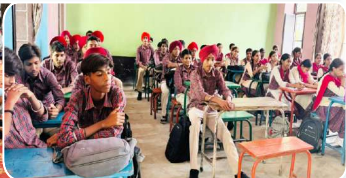
ਕੇਂਦਰ ਗੁੱਜਰਵਾਲ ਦੇ ਸਰਕਾਰੀ ਸੀ.ਸਕੈ. ਸਕੂਲ ਕਿਲਾ ਰਾਏਪੁਰ ਵਿਖੇ ਲੱਗ ਰਹੀ ਬੱਚਿਆਂ ਦੀ ਗੁਰਮਤਿ ਕਲਾਸ