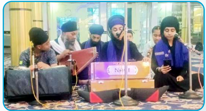
ਕੇਂਦਰ ਦੁਰਗ (ਛੱਤੀਸਗੜ੍ਹ) ਵਿਖੇ ਬੱਚੇ ਆਸਾ ਕੀ ਵਾਰ ਦਾ ਕੀਰਤਨ ਕਰਦੇ ਹੋਏ।