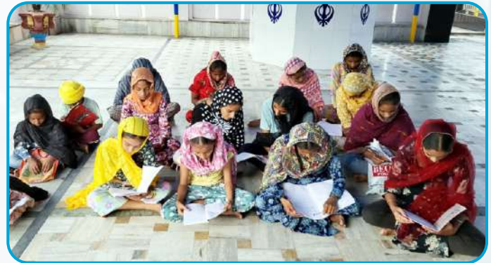
ਕੇਂਦਰ ਪਰਿੰਗੜੀ ਵਿਖੇ ਲੱਗ ਰਹੀ ਬੱਚਿਆਂ ਦੀ ਗੁਰਮਤਿ ਕਲਾਸ