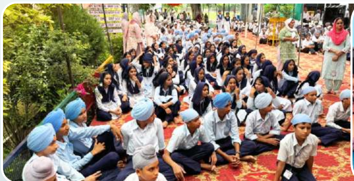
ਕੇਂਦਰ ਗੁੱਜਰਵਾਲ ਦੇ ਜੀ.ਐਚ.ਜੀ.ਸੀ. ਸਕੂਲ ਅਹਿਮਦਗੜ੍ਹ ਵਿਖੇ ਲੱਗ ਰਹੀ ਬੱਚਿਆਂ ਦੀ ਗੁਰਮਤਿ ਕਲਾਸ