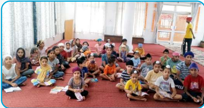
ਕੇਂਦਰ ਚੱਕ ਕਲਾਂ ਵਿਖੇ ਲੱਗ ਰਹੀ ਬੱਚਿਆਂ ਦੀ ਗੁਰਮਤਿ ਕਲਾਸ