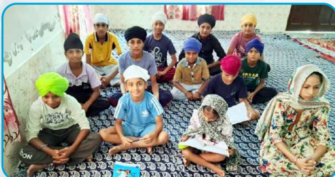
ਪਿੰਡ ਜੋਣੇਕੇ ਵਿਖੇ ਲੱਗ ਰਹੀ ਬੱਚਿਆਂ ਦੀ ਗੁਰਮਤਿ ਕਲਾਸ