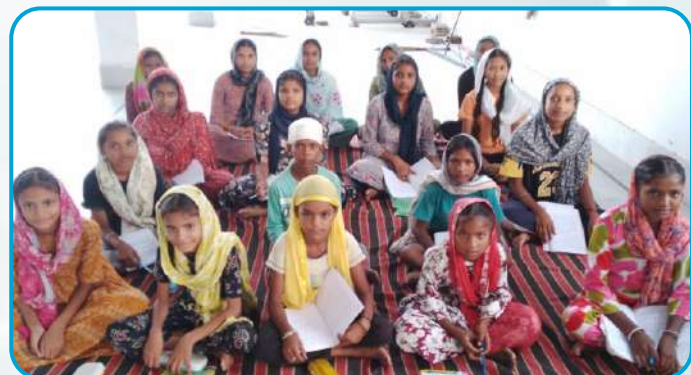
ਕੇਂਦਰ ਮਾਲੂਵਾਲ ਦੇ ਪਿੰਡ ਭੁੱਚਰ ਵਿਖੇ ਲੱਗ ਰਹੀ ਬੱਚਿਆਂ ਦੀ ਗੁਰਮਤਿ ਕਲਾਸ