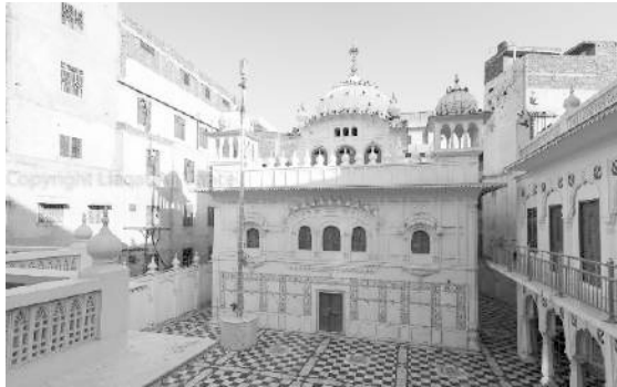
ਗੁਰਦੁਆਰਾ ਜਨਮ ਅਸਥਾਨ ਚੂਨਾ ਮੰਡੀ, ਲਾਹੌਰ ਪਾਕਿਸਤਾਨ

ਪ੍ਰਚਾਰ ਹੋਣ ਲੱਗਾ। ਜਿਸ ਤਰ੍ਹਾਂ ਪਹਿਲਾਂ ਸੰਗਤਾਂ ਖੜੂਰ ਸਾਹਿਬ ਇਕੱਤਰ ਹੁੰਦੀਆਂ ਸਨ ਹੁਣ ਗੋਇੰਦਵਾਲ ਸਾਹਿਬ ਆਉਣ ਲੱਗ ਪਈਆਂ। ਜੇਠਾ ਜੀ ਦਾ ਬਹੁਤਾ ਸਮਾਂ ਸੰਗਤਾਂ ਦੀ ਸੇਵਾ ਵਿੱਚ