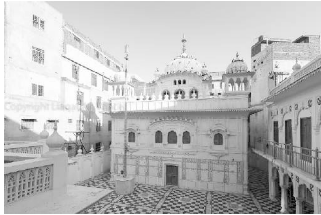
गुरुद्वारा जन्म अस्थान गुरु रामदास जी, चूना मंडी, लाहौर (पाकिस्तान)

श्री गुरु रामदास जी का प्रकाश लाहौर (पाकिस्तान) शहर के बाजार चूना मंडी में 9 अक्टूबर सन् 1534 को हुआ। आप जी के पिता श्री हरदास जी और माता दया कौर जी थे। पहली