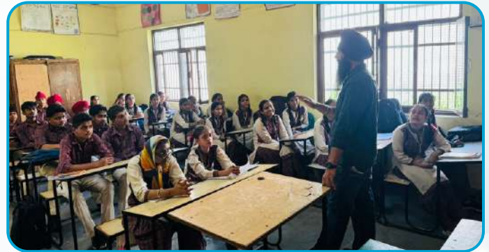
ਕੇਂਦਰ ਗੁੱਜਰਵਾਲ ਵਲੋਂ ਸਰਕਾਰੀ ਸਕੂਲ ਡੇਹਲੋਂ ਵਿਖੇ ਲੱਗ ਰਹੀ ਗੁਰਮਤਿ ਕਲਾਸ।