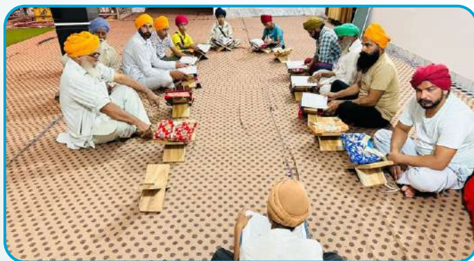
ਕੇਂਦਰ ਖਨਾਲ ਕਲਾਂ ਵਿਖੇ ਵੀਰਾਂ ਦੀ ਲੱਗ ਰਹੀ ਗੁਰਮਤਿ ਕਲਾਸ।