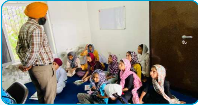
ਕੇਂਦਰ ਬੁਗਰਾ ਵਿਖੇ ਲੱਗ ਰਹੀ ਬੱਚਿਆਂ ਦੀ ਕੰਪਿਊਟਰ ਕਲਾਸ