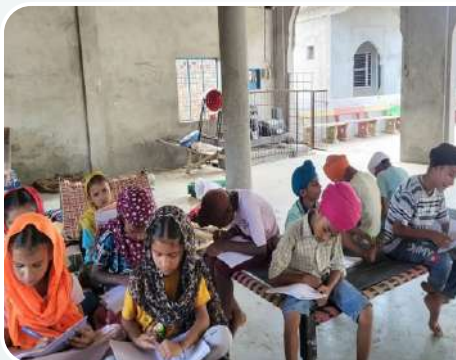
ਕੇਂਦਰ ਤਰਨਤਾਰਨ ਦੇ ਪਿੰਡ ਕੋਟਦਾਤਾ ਵਿਖੇ ਲੱਗ ਰਹੀ ਬੱਚਿਆਂ ਦੀ ਗੁਰਮਤਿ ਕਲਾਸ।