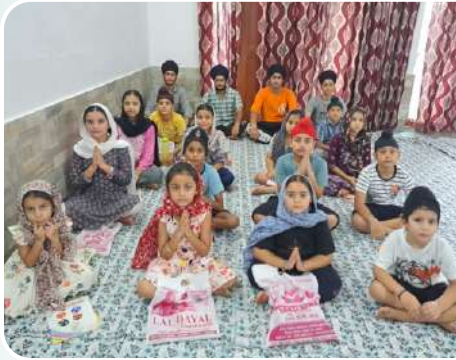
ਕੇਂਦਰ ਜੰਮੂ ਦੇ ਗੁਰਦੁਆਰਾ ਗੁਰੂ ਸਿੰਘ ਸਭਾ ਫਿੰਦੜ ਵਿਖੇ ਲੱਗ ਰਹੀ ਬੱਚਿਆਂ ਦੀ ਗੁਰਮਤਿ ਕਲਾਸ