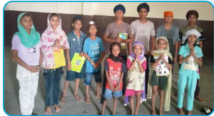
ਕੇਂਦਰ ਅੱਪਰਾ ਵਲੋਂ ਪਿੰਡ ਹੁਸੈਨਪੁਰ (ਲੁਧਿਆਣਾ) ਵਿਖੇ ਗੁਰਮਤਿ ਕਲਾਸ ਲਗਾਉਣ ਵਾਲੇ ਬੱਚੇ।