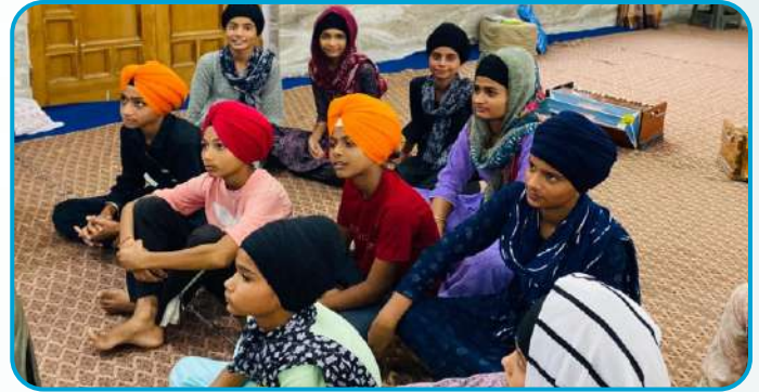
ਕੇਂਦਰ ਬੁਗਰਾ ਵਿਖੇ ਲੱਗ ਰਹੀ ਬੱਚਿਆਂ ਦੀ ਗੁਰਮਤਿ ਕਲਾਸ।