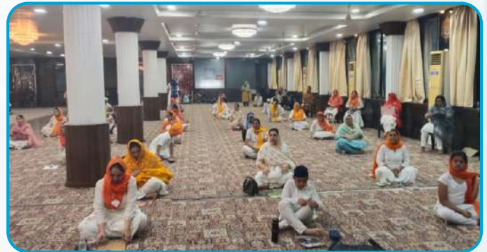
ਕੇਂਦਰ ਦੁਰਗ (ਫੱਤੀਸਗੜ੍ਹ) ਦੇ ਗੁ: ਸਿੰਘ ਸਭਾ ਵਿਖੇ ਬੱਚਿਆਂ ਦੀ ਧਾਰਮਿਕ ਪ੍ਰੀਖਿਆ ਲਈ ਗਈ।