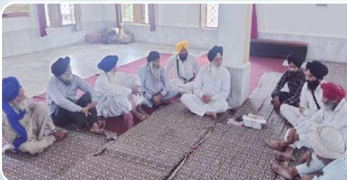
ਕੇਂਦਰ ਕਾਲੇਵਾਲ ਲੱਲੀਆਂ ਵਿਖੇ ਪਿੰਡ ਵਾਸੀਆਂ ਅਤੇ ਪ੍ਰਬੰਧਕ ਵੀਰਾਂ ਨਾਲ ਕਲਾਸ ਲਗਾਉਣ ਸਬੰਧੀ ਵਿਚਾਰ ਵਟਾਂਦਰਾ ਕੀਤਾ ਗਿਆ।