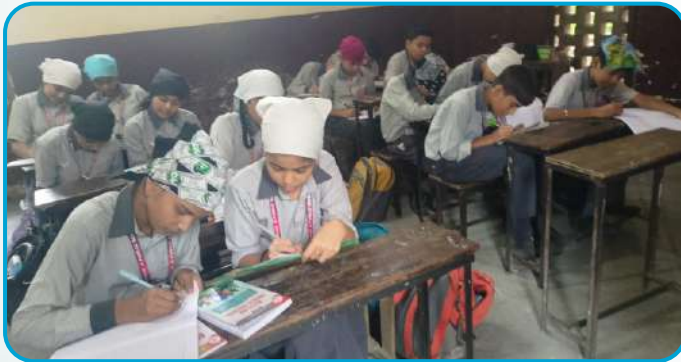
ਕੇਂਦਰ ਅੱਪਰਾ ਦੇ ਬਾਬਾ ਦੀਪ ਸਿੰਘ ਕਾਨਵੈਂਟ ਸਕੂਲ ਰੁੜਕਾ ਵਿਖੇ ਲੱਗ ਰਹੀ ਗੁਰਮਤਿ ਕਲਾਸ