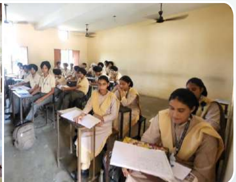
ਕੇਂਦਰ ਤਰਨਤਾਰਨ ਦੇ ਸ.ਸ.ਸ. ਹਰੀ ਸਿੰਘ ਸਕੂਲ ਨੰਦਪੁਰ ਵਿਖੇ ਲੱਗ ਰਹੀ ਗੁਰਮਤਿ ਕਲਾਸ।