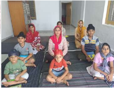
ਕੇਂਦਰ ਜੰਮੂ ਦੇ ਗੁਰਦੁਆਰਾ ਸਾਹਿਬ ਮਮਕਾ ਵਿਖੇ ਲੱਗ ਰਹੀ ਬੱਚਿਆਂ ਦੀ ਗੁਰਮਤਿ ਕਲਾਸ