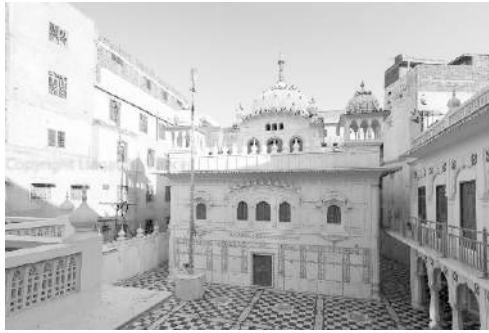
Gurdwara Janam Asthan Guru Ramdas Ji Choon Mandi, Lahore (Pak)

My condition, O my True Guru - that condition, O Lord, is known only to You.