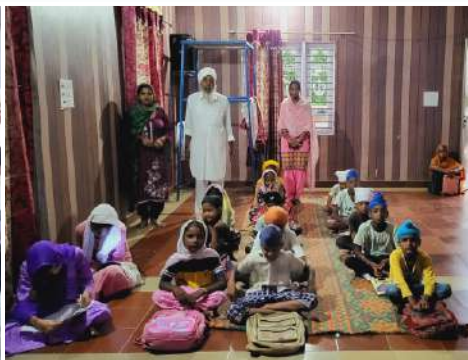
ਕੇਂਦਰ ਤਰਨਤਾਰਨ ਦੇ ਪਿੰਡ ਸੁਹਾਵਾ ਵਿਖੇ ਲੱਗ ਰਹੀ ਬੱਚਿਆਂ ਦੀ ਗੁਰਮਤਿ ਕਲਾਸ।