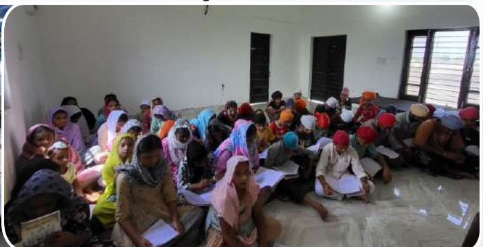
ਕੇਂਦਰ ਤਰਨਤਾਰਨ ਦੇ ਪਿੰਡ ਰੂੜੋਆਸਲ ਵਿਖੇ ਲੱਗ ਰਹੀ ਬੱਚਿਆਂ ਦੀ ਗੁਰਮਤਿ ਕਲਾਸ।