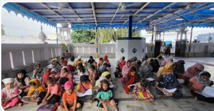
ਕੇਂਦਰ ਪਰਿੰਗੜੀ ਵਿਖੇ ਲੱਗ ਰਹੀਆਂ ਬੱਚਿਆਂ ਧਾਰਮਿਕ ਕਲਾਸ।