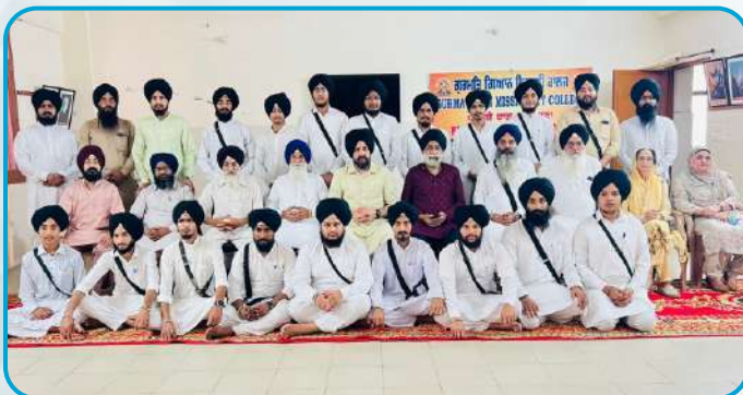
ਪਿਛਲੇ ਦਿਨੀਂ ਗੁਰਮਤਿ ਗਿਆਨ ਮਿਸ਼ਨਰੀ ਕਾਲਜ ਵਿਖੇ 27ਵੇਂ ਬੈਚ ਦੇ ਪੰਜਾਬ ਅਤੇ ਨਾਗਪੁਰ ਦੇ ਵਿਦਿਆਰਥੀਆਂ ਦਾ ਵਿਦਾਇਗੀ ਸਮਾਰੋਹ ਕੀਤਾ ਗਿਆ।