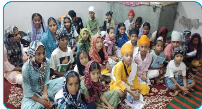
ਕੇਂਦਰ ਮਾਲੂਵਾਲ ਵਿਖੇ ਲੱਗ ਰਹੀ ਬੱਚਿਆਂ ਦੀ ਗੁਰਮਤਿ ਕਲਾਸ।