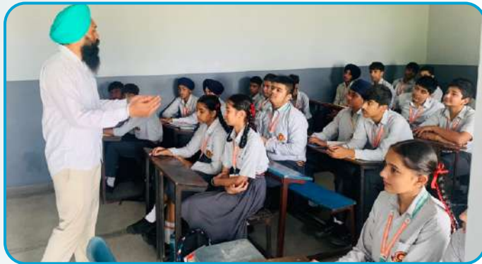
ਕੇਂਦਰ ਅੱਪਰਾ ਵਲੋਂ ਦਸਮੇਸ਼ ਹਾਈ ਸਕੂਲ ਪਿੰਡ ਅੱਟੀ (ਜਲੰਧਰ) ਵਿਖੇ ਨੈਤਿਕ ਸਿੱਖਿਆ ਦੀ ਕਲਾਸ ਲਗਾਈ ਗਈ।