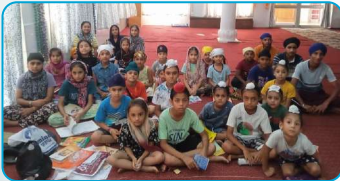
ਕੇਂਦਰ ਚੱਕ ਕਲਾਂ ਵਿਖੇ ਲੱਗ ਰਹੀ ਬੱਚਿਆਂ ਦੀ ਗੁਰਮਤਿ ਕਲਾਸ।