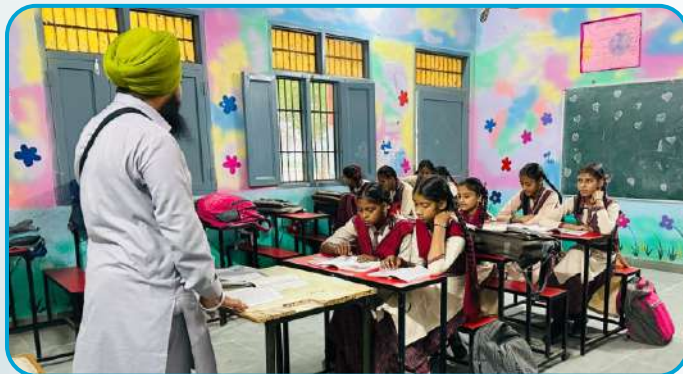
ਕੇਂਦਰ ਖਨਾਲ ਕਲਾਂ ਦੇ ਸਰਕਾਰੀ ਸਕੂਲ ਪਿੰਡ ਜਨਾਲ ਵਿਖੇ ਲੱਗ ਰਹੀ ਬੱਚਿਆਂ ਦੀ ਗੁਰਮਤਿ ਕਲਾਸ