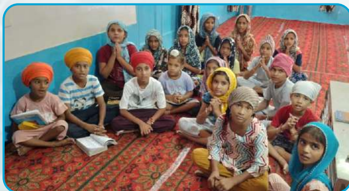
ਕੇਂਦਰ ਮਾਲੂਵਾਲ ਦੇ ਪਿੰਡ ਪੱਧਰੀ ਵਿਖੇ ਬੱਚਿਆਂ ਦੀ ਲੱਗ ਰਹੀ ਗੁਰਮਤਿ ਕਲਾਸ।