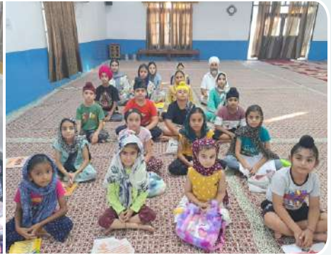
ਕੇਂਦਰ ਜੰਮੂ ਦੇ ਗੁਰਦੁਆਰਾ ਸਿੰਘ ਸਭਾ ਸਿੰਘਪੁਰਾ ਮੁਰਾਲੀਆਂ ਵਿਖੇ ਲੱਗ ਰਹੀ ਬੱਚਿਆਂ ਦੀ ਗੁਰਮਤਿ ਕਲਾਸ