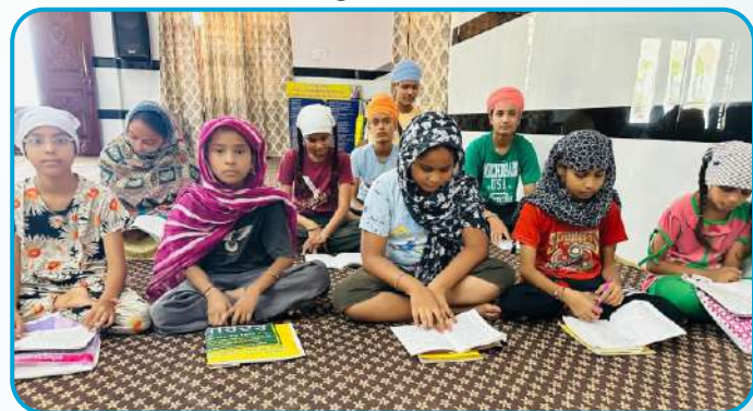
ਕੇਂਦਰ ਖਨਾਲ ਕਲਾਂ ਦੇ ਪਿੰਡ ਮੁਨਸ਼ੀਵਾਲਾ ਵਿਖੇ ਲੱਗ ਰਹੀ ਬੱਚਿਆਂ ਦੀ ਗੁਰਮਤਿ ਕਲਾਸ।