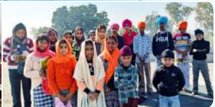
ਕੇਂਦਰ ਤਰਨਤਾਰਨ ਦੇ ਪਿੰਡ ਰੂੜੋਆਸਲ ਵਿਖੇ ਗੁਰਮਤਿ ਕਲਾਸ ਲਗਾਉਣ ਵਾਲੇ ਬੱਚੇ