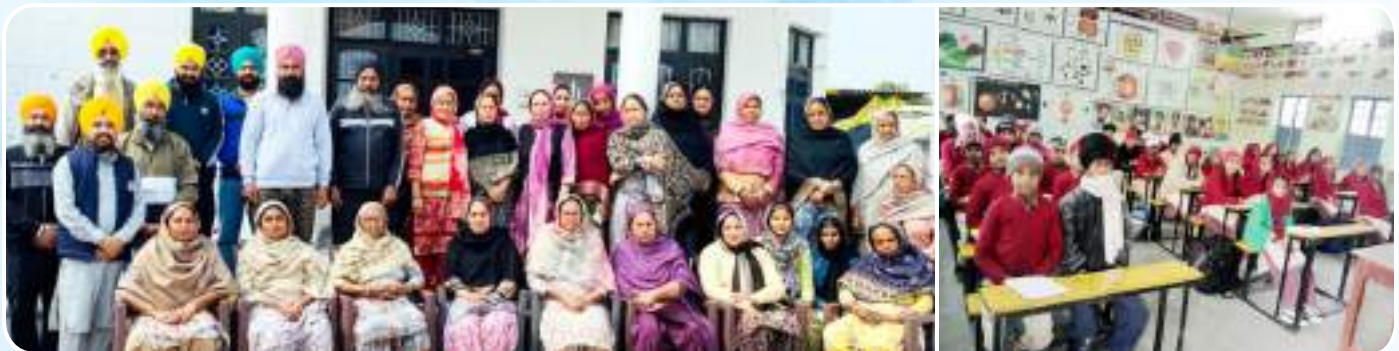
ਕੇਂਦਰ ਬੁਗਰਾ ਦੇ ਵੀਰਾਂ ਅਤੇ ਮਾਤਾਵਾਂ ਵਲੋਂ ਗੁਰੂ ਤੇਗ ਬਹਾਦਰ ਸਾਹਿਬ ਜੀ ਦੀ 350 ਸਾਲਾ ਸ਼ਹੀਦੀ ਸ਼ਤਾਬਦੀ ਨੂੰ ਸਮਰਪਿਤ ਘਰ ਘਰ ਜਾ ਕੇ ਸੰਗਤ ਨੂੰ ਸਹਿਜ ਪਾਠ ਕਰਨ ਲਈ ਪ੍ਰੇਰਿਤ ਕੀਤਾ ਗਿਆ।