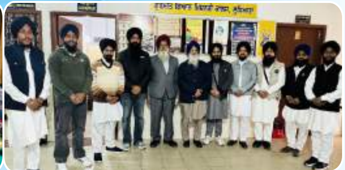
ਮਹੀਨਾਵਾਰੀ ਪ੍ਰਚਾਰਕ ਵੀਰਾਂ ਦੀ ਮੀਟਿੰਗ ਦੌਰਾਨ ਪ੍ਰਚਾਰਕਾਂ ਵਲੋਂ ਹਾਜ਼ਰੀ