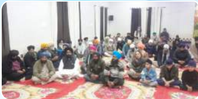
ਕੇਂਦਰ ਅੱਪਰਾ ਵਿਖੇ ਸ਼ਹੀਦ ਬਾਬਾ ਦੀਪ ਸਿੰਘ ਜੀ ਦੇ ਜਨਮ ਦਿਹਾੜੇ ਸਬੰਧੀ ਗੁਰਮਤਿ ਸਮਾਗਮ ਕਰਵਾਇਆ ਗਿਆ।