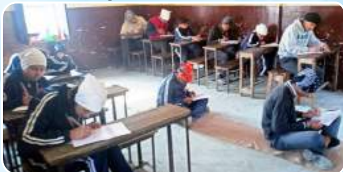
ਸ਼ਹੀਦ ਬਾਬਾ ਦੀਪ ਸਿੰਘ ਪਬਲਿਕ ਸਕੂਲ ਰੁੜਕਾ (ਜਲੰਧਰ) ਵਿਖੇ ਧਾਰਮਿਕ ਅਤੇ ਨੈਤਿਕ ਪ੍ਰੀਖਿਆ ਲਈ ਗਈ।