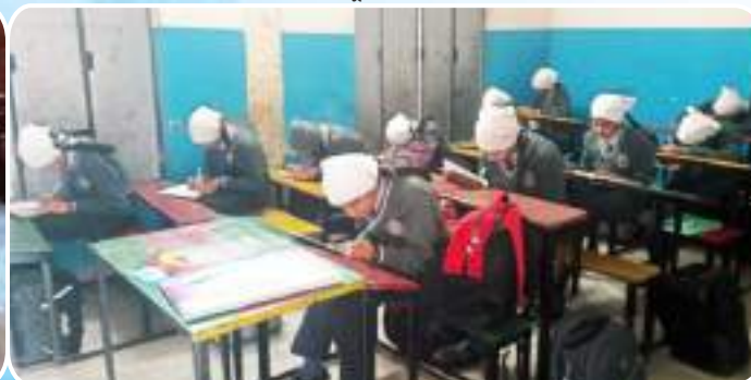
ਕੇਂਦਰ ਅੱਪਰਾ ਦੇ ਪੰਜਾਬ ਕਾਨਵੈਂਟ ਅਕੈਡਮੀ ਬੜਾ ਪਿੰਡ ਵਿਖੇ ਧਾਰਮਿਕ ਅਤੇ ਨੈਤਿਕ ਪ੍ਰੀਖਿਆ ਲਈ ਗਈ।