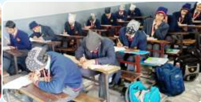
ਦਸਮੇਸ਼ ਕਾਨਵੈਂਟ ਹਾਈ ਸਕੂਲ ਪਿੰਡ ਅੱਟੀ (ਜਲੰਧਰ) ਵਿਖੇ ਧਾਰਮਿਕ ਅਤੇ ਨੈਤਿਕ ਪ੍ਰੀਖਿਆ ਲਈ ਗਈ।