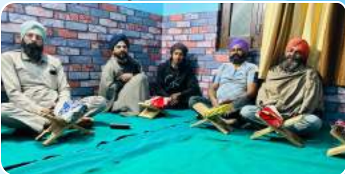
ਕੇਂਦਰ ਖਨਾਲ ਕਲਾਂ ਵਿਖੇ ਸ਼ਾਮ ਨੂੰ ਲੱਗ ਰਹੀ ਵੀਰਾਂ ਦੀ ਗੁਰਬਾਣੀ ਸੰਥਿਆ ਦੀ ਕਲਾਸ