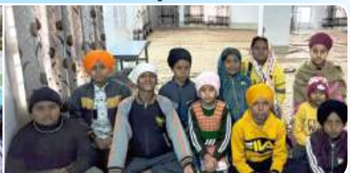
ਕੇਂਦਰ ਰਤਨਗੜ੍ਹ ਸਿੰਧੜਾ ਦੇ ਪਿੰਡ ਤੁਰਬਨਜਾਰਾ ਵਿਖੇ ਲੱਗ ਰਹੀ ਬੱਚਿਆਂ ਦੀ ਗੁਰਮਤਿ ਕਲਾਸ