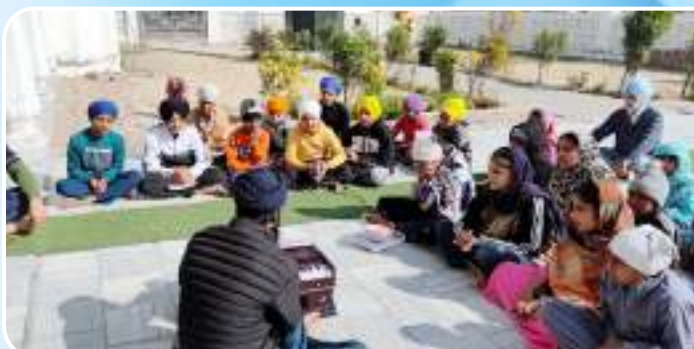
ਕੇਂਦਰ ਰਤਨਗੜ੍ਹ ਸਿੰਧੜਾ ਵਿਖੇ ਲੱਗ ਰਹੀ ਬੱਚਿਆਂ ਦੀ ਗੁਰਮਤਿ ਸੰਗੀਤ ਕਲਾਸ