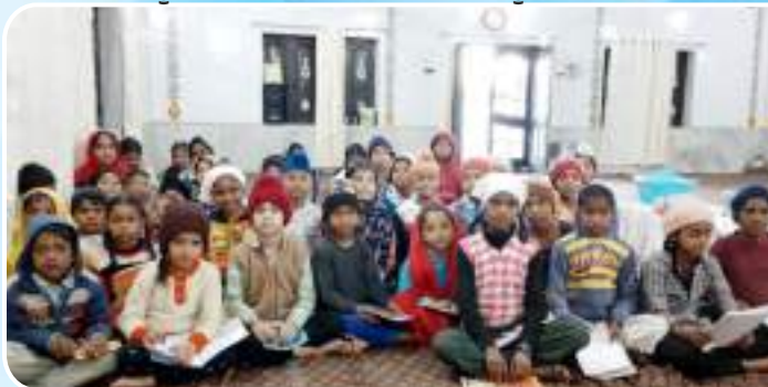
ਕੇਂਦਰ ਮਾਲੂਵਾਲ ਦੇ ਪਿੰਡ ਭੁੱਚਰ ਵਿਖੇ ਲੱਗ ਰਹੀ ਬੱਚਿਆਂ ਦੀ ਗੁਰਮਤਿ ਕਲਾਸ