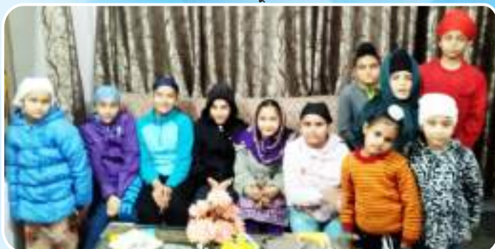
ਕੇਂਦਰ ਚੱਕ ਕਲਾਂ ਵਿਖੇ ਗੁਰਮਤਿ ਕਲਾਸ ਲਗਾਉਣ ਵਾਲੇ ਬੱਚੇ