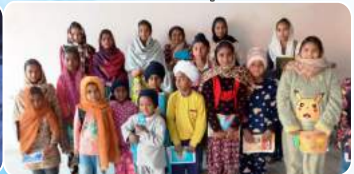
ਕੇਂਦਰ ਪਰਿੰਗੜੀ ਵਿਖੇ ਲੱਗ ਰਹੀ ਬੱਚਿਆਂ ਦੀ ਗੁਰਮਤਿ ਕਲਾਸ।