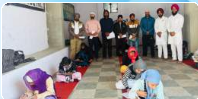
ਕੇਂਦਰ ਲਤਾਲਾ ਦੇ ਪਿੰਡ ਕਾਲਖ ਵਿਖੇ ਬੱਚਿਆਂ ਦੀ ਧਾਰਮਿਕ ਪ੍ਰੀਖਿਆ ਲਈ ਗਈ ਉਪਰੰਤ ਬੱਚਿਆਂ ਨੂੰ ਸਨਮਾਨਤ ਕੀਤਾ ਗਿਆ।