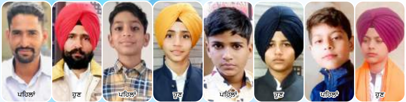
ਕੇਂਦਰ ਬੁਗਰਾ ਦੇ ਨੌਜਵਾਨ ਅਤੇ ਬੱਚਿਆਂ ਨੇ ਕੇਸਾਂ ਦੀ ਸੰਭਾਲ ਕਰਨ ਦਾ ਪ੍ਰਣ ਲਿਆ।