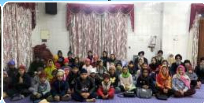
ਕੇਂਦਰ ਚੱਕ ਕਲਾਂ ਦੇ ਪਿੰਡ ਹੇਰਾਂ ਵਿਖੇ ਲੱਗ ਰਹੀ ਬੱਚਿਆਂ ਦੀ ਗੁਰਮਤਿ ਕਲਾਸ