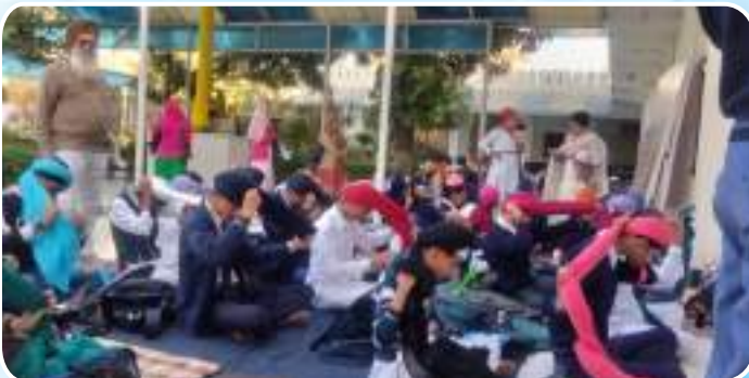
ਪਿਛਲੇ ਦਿਨੀਂ ਗੁ: ਸਿੰਘ ਸਭਾ ਲੁਧਿਆਣਾ ਵਿਖੇ ਦਸਤਾਰ ਮੁਕਾਬਲੇ ਕਰਵਾਏ ਗਏ