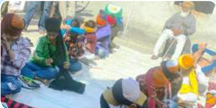
ਕੇਂਦਰ ਲਤਾਲਾ ਦੇ ਪਿੰਡ ਨੰਗਲ ਨੇੜੇ ਡੇਹਲੋਂ ਵਿਖੇ ਬੱਚਿਆਂ ਦਾ ਦਸਤਾਰ ਮੁਕਾਬਲਾ ਕਰਵਾਇਆ ਗਿਆ।