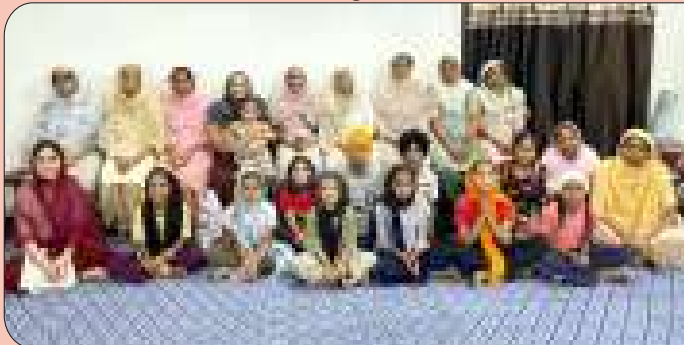
ਕੇਂਦਰ ਬੁਗਰਾ ਵਿਖੇ ਬੱਚਿਆਂ ਅਤੇ ਮਾਤਾਵਾਂ ਦੀ ਲੱਗ ਰਹੀ ਗੁਰਮਤਿ ਕਲਾਸ।