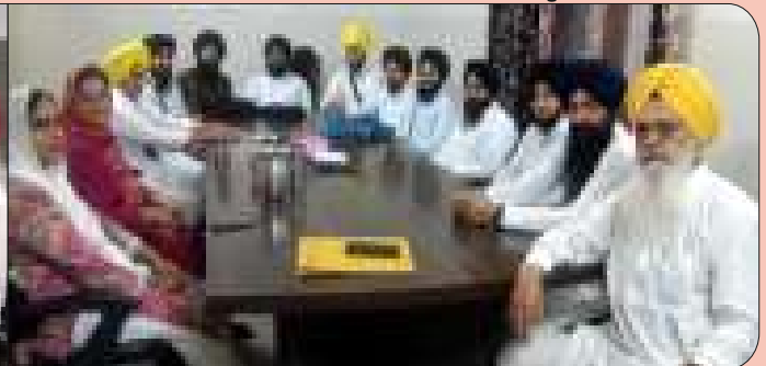
ਗੁਰਮਤਿ ਗਿਆਨ ਮਿਸ਼ਨਰੀ ਕਾਲਜ ਲੁਧਿਆਣਾ ਵਿਖੇ ਮਹੀਨਾਵਾਰ ਮੀਟਿੰਗ ਦੌਰਾਨ ਪ੍ਰਚਾਰਕਾਂ ਵਲੋਂ ਸ਼ਿਰਕਤ ਕੀਤੀ ਗਈ।