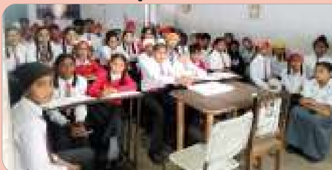
ਸੈਂਟ ਜੋਨਸ ਅਕੈਡਮੀ ਪਿੰਡ ਸ਼ੰਕਰ (ਜਲੰਧਰ) ਵਿਖੇ ਲਗ ਰਹੀ ਗੁਰਮਤਿ ਕਲਾਸ।