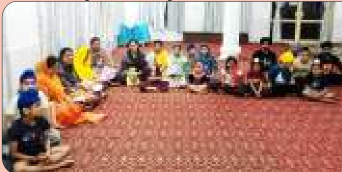
ਕੇਂਦਰ ਚੱਕ ਕਲਾਂ ਦੇ ਗੁਰਦੁਆਰਾ ਸਾਹਿਬ ਵੱਡੀ ਸੰਗਤ ਵਿਖੇ ਲੱਗ ਰਹੀ ਬੱਚਿਆਂ ਦੀ ਗੁਰਮਤਿ ਕਲਾਸ।