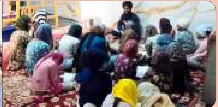
ਕੇਂਦਰ ਮਾਲੂਵਾਲ ਦੇ ਪਿੰਡ ਸੁਰ ਸਿੰਘ ਵਿਖੇ ਲੱਗ ਰਹੀ ਬੱਚਿਆਂ ਦੀ ਗੁਰਮਤਿ ਕਲਾਸ।