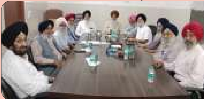
ਗੁਰਮਤਿ ਗਿਆਨ ਮਿਸ਼ਨਰੀ ਕਾਲਜ ਲੁਧਿਆਣਾ ਵਿਖੇ ਸੀਨੀਅਰ ਸਿਟੀਜਨ ਮੈਂਬਰ ਹਰ ਬੁੱਧਵਾਰ ਦੀ ਹਫਤਾਵਾਰੀ ਮੀਟਿੰਗ ਵਿਚ ਹਿੱਸਾ ਲੈਂਦੇ ਹੋਏ।