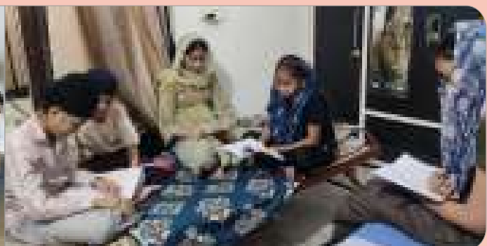
ਕੇਂਦਰ ਮਹਾਂਸਿੰਘਨਗਰ (ਲੁਧਿਆਣਾ) ਵਿਖੇ ਲੱਗ ਰਹੀ ਬੱਚਿਆਂ ਦੀ ਗੁਰਮਤਿ ਕਲਾਸ।