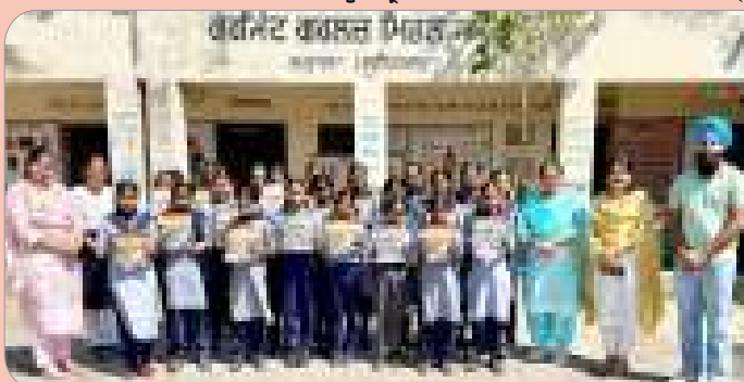
ਕੇਂਦਰ ਲਤਾਲਾ ਦੇ ਸਰਕਾਰੀ ਗਰਲਜ਼ ਮਿਡਲ ਸਕੂਲ ਵਿਖੇ ਵਿਦਿਆਰਥਣਾਂ ਨੂੰ ਮਾਸਿਕ ਰਸਾਲਾ 'ਗੁਰਮਤਿ ਵਿਰਸਾ' ਵੰਡਿਆ ਗਿਆ।