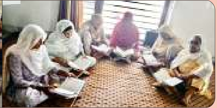
ਕੇਂਦਰ ਖਨਾਲ ਖੁਰਦ ਵਿਖੇ ਮਾਤਾਵਾਂ ਦੀ ਲੱਗ ਰਹੀ ਗੁਰਬਾਣੀ ਸੰਬਿਆ ਦੀ ਕਲਾਸ।