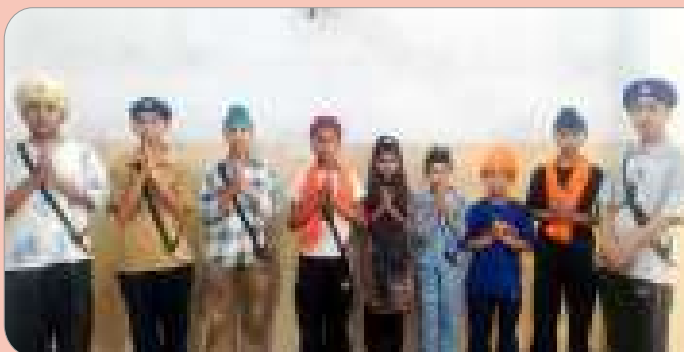
ਗਰੇਸ ਪਬਲਿਕ ਸਕੂਲ ਸ਼ਿਮਲਾਪੁਰੀ, ਲੁਧਿਆਣਾ ਦੇ ਬੱਚਿਆਂ ਨੇ ਖੰਡੇ ਦੀ ਪਾਹੁਲ ਪ੍ਰਾਪਤ ਕੀਤੀ।