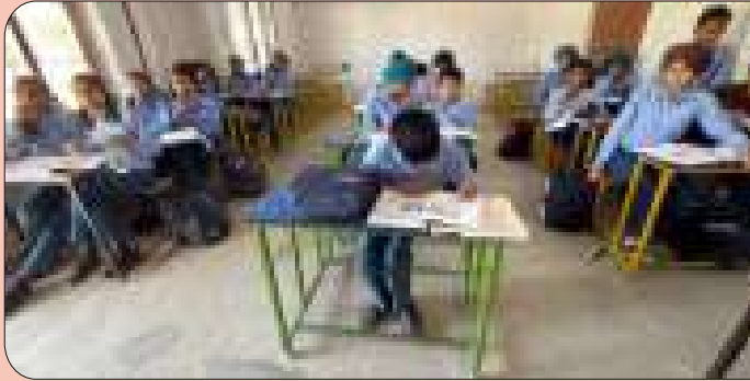
ਕੇਂਦਰ ਖਨਾਲ ਖੁਰਦ ਦੇ ਪੇਂਡੂ ਵਿਕਾਸ ਸੀ.ਸੈ. ਸਕੂਲ, ਖੇਤਲਾ (ਸੰਗਰੂਰ) ਵਿਖੇ ਲੱਗ ਰਹੀ ਬੱਚਿਆਂ ਦੀ ਗੁਰਮਤਿ ਕਲਾਸ।