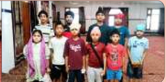
ਕੇਂਦਰ ਚੱਕ ਕਲਾਂ ਦੇ ਪਿੰਡ ਭੰਡਾਲ ਖੁਰਦ ਵਿਖੇ ਗੁਰਮਤਿ ਕਲਾਸ ਲਗਾਉਣ ਵਾਲੇ ਬੱਚੇ।