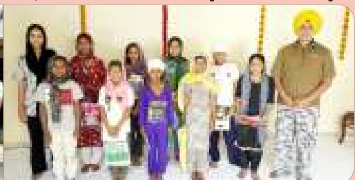
ਕੇਂਦਰ ਲਤਾਲਾ ਦੇ ਗੁਰਮਤਿ ਕਲਾਸ ਲਗਾਉਣ ਵਾਲੇ ਬੱਚੇ।