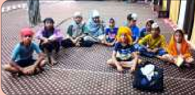
ਕੇਂਦਰ ਨਵਾਂਸ਼ਹਿਰ ਦੇ ਪਿੰਡ ਮਜਾਰੀ ਵਿਖੇ ਲੱਗ ਰਹੀ ਬੱਚਿਆਂ ਦੀ ਗੁਰਮਤਿ ਕਲਾਸ।