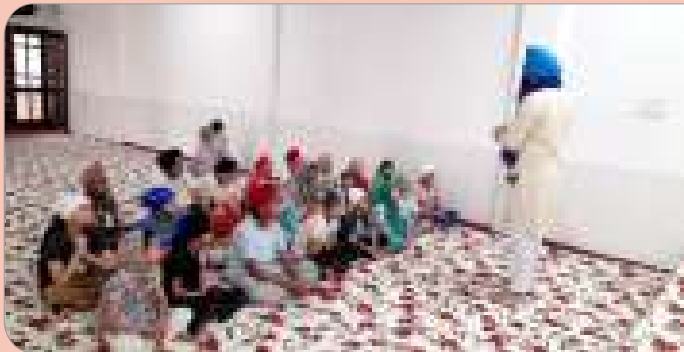
ਕੇਂਦਰ ਅੱਪਰਾ ਦੇ ਪਿੰਡ ਥਲਾ ਵਿਖੇ ਲੱਗ ਰਹੀ ਬੱਚਿਆਂ ਦੀ ਗੁਰਮਤਿ ਕਲਾਸ