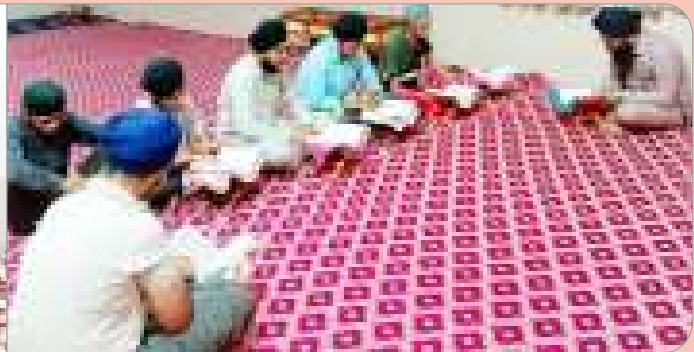
ਕੇਂਦਰ ਅੱਪਰਾ ਦੇ ਪਿੰਡ ਲੋਹਾਰਾ ਵਿਖੇ ਲੱਗ ਨੌਜਵਾਨ ਵੀਰ ਗੁਰਬਾਣੀ ਸੰਬੰਧੀ ਕਲਾਸ ਲਗਾਉਂਦੇ ਹੋਏ।