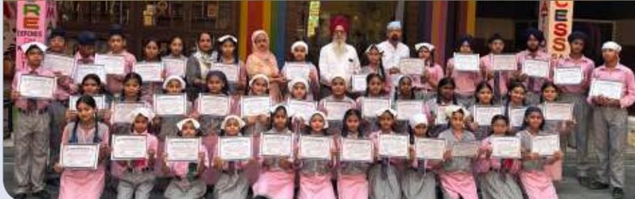
ਕੇਂਦਰ ਮਹਾਂਸਿੰਘਨਗਰ (ਲੁਧਿਆਣਾ) ਵਿਖੇ ਸਾਈਂ ਪਬਲਿਕ ਸਕੂਲ ਵਿਖੇ ਲੱਗੇ ਗੁਰਮਤਿ ਕੈਂਪ ਉਪਰੰਤ ਬੱਚਿਆਂ ਨੂੰ ਸਨਮਾਨਤ ਕੀਤਾ ਗਿਆ।