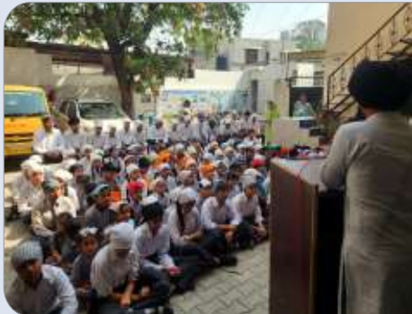
ਕੇਂਦਰ ਅੱਪਰਾ ਵੱਲੋਂ ਸ਼ਹੀਦ ਬਾਬਾ ਦੀਪ ਸਿੰਘ ਪਬਲਿਕ ਸਕੂਲ ਰੁੜਕਾ ਖੁਰਦ ਵਿਖੇ ਗੁਰਮਤਿ ਕੈਂਪ ਲਗਾਇਆ ਗਿਆ