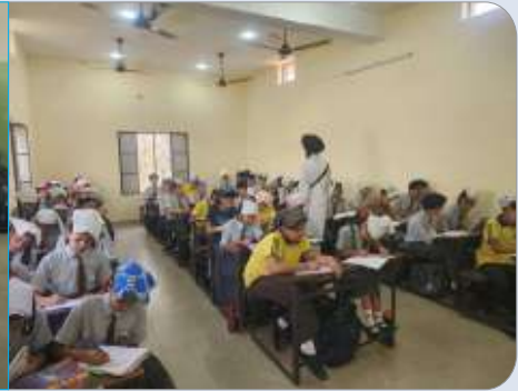
ਦਸਮੇਸ਼ ਹਾਈ ਸਕੂਲ, ਅੱਟੀ (ਜਲੰਧਰ) ਵਿਖੇ ਗੁਰਮਤਿ ਕੈਂਪ ਦੌਰਾਨ ਲਗਾਈ ਜਾ ਰਹੀ ਕਲਾਸ।