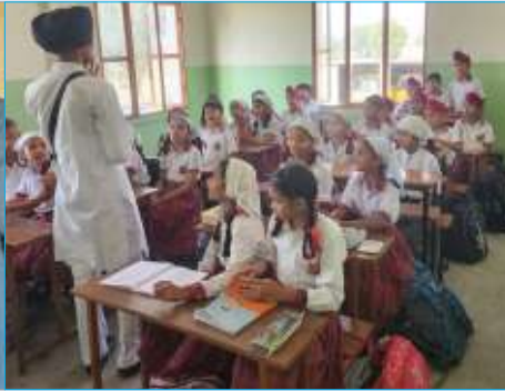
ਗਿਆਨ ਸਿੰਘ ਪਬਲਿਕ ਸਕੂਲ, ਤਰਖਾਣਵਾਲਾ (ਕਪੂਰਥਲਾ) ਵਿਖੇ ਗੁਰਮਤਿ ਕੈਂਪ ਦੌਰਾਨ ਲਗਾਈ ਜਾ ਰਹੀ ਕਲਾਸ।