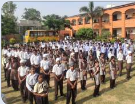
ਕੇਂਦਰ ਨਵਾਂਸ਼ਹਿਰ ਵੱਲੋਂ ਸ੍ਰੀ ਗੁਰੂ ਹਰਿਰਾਏ ਪਬਲਿਕ ਸੀ.ਸੇ. ਸਕੂਲ ਮੁਕੰਦਪੁਰ ਵਿਖੇ ਗੁਰਮਤਿ ਕੈਂਪ ਲਗਾਇਆ ਗਿਆ