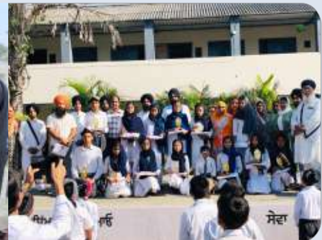
ਕੇਂਦਰ ਨਵਾਂਸ਼ਹਿਰ ਵੱਲੋਂ ਸ੍ਰੀ ਗੁਰੂ ਹਰਿਗੋਬਿੰਦ ਖਾਲਸਾ ਹਾਈ ਸਕੂਲ ਬੰਗਾ ਵਿਖੇ ਚਾਰ ਰੋਜ਼ਾ ਗੁਰਮਤਿ ਕੈਂਪ ਲਗਾਇਆ ਗਿਆ