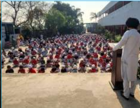
ਕੇਂਦਰ ਅੱਪਰਾ ਵੱਲੋਂ ਪੰਜਾਬ ਅਕੈਡਮੀ ਬੜਾ ਪਿੰਡ ਵਿਖੇ ਗੁਰਮਤਿ ਕੈਂਪ ਲਗਾਇਆ ਗਿਆ