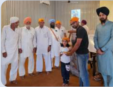
ਪਿੰਡ ਮੁਹੰਮਦਪੁਰ, ਮੇਰਠ (ਯੂ.ਪੀ) ਵਿਖੇ ਕਾਲਜ ਵਲੋਂ ਗੁਰਮਤਿ ਕੈਂਪ ਲਗਾਇਆ ਗਿਆ