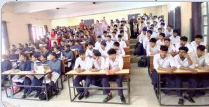
ਕੇਂਦਰ ਨਵਾਂਸ਼ਹਿਰ ਵੱਲੋਂ ਸਿੱਖ ਨੈਸ਼ਨਲ ਕਾਲਜ ਬੰਗਾ ਵਿਖੇ ਚਾਰ ਦਿਨਾਂ ਗੁਰਮਤਿ ਕੈਂਪ ਲਗਾਇਆ ਗਿਆ