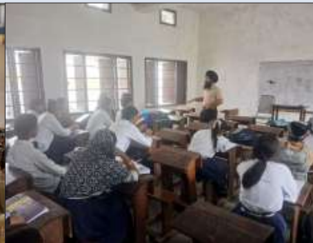
ਕੇਂਦਰ ਨਵਾਂਸ਼ਹਿਰ ਵੱਲੋਂ ਬਾਬਾ ਵਜ਼ੀਰ ਸਿੰਘ ਸੀ.ਸੇ. ਸਕੂਲ ਨਵਾਂਸ਼ਹਿਰ ਵਿਖੇ ਗੁਰਮਤਿ ਕੈਂਪ ਲਗਾਇਆ ਗਿਆ।