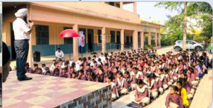
ਕੇਂਦਰ ਨਵਾਂਸ਼ਹਿਰ ਵੱਲੋਂ ਕੇਂਦਰ ਕਾਲੇਵਾਲ ਲੱਲੀਆਂ ਦੇ ਸਹਿਯੋਗ ਸਦਕਾ ਪਿੰਡ ਸਿੰਬਲ ਮਜ਼ਾਰਾ ਵਿਖੇ ਗੁਰਮਤਿ ਕੈਂਪ ਲਗਾਇਆ ਗਿਆ