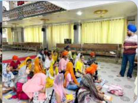
ਅਮਰਾਵਤੀ (ਮਹਾਂਰਾਸ਼ਟਰ) ਵਿਖੇ ਗੁਰਦੁਆਰਾ ਸਾਹਿਬ 'ਚ ਲੱਗ ਰਿਹਾ ਬੱਚਿਆਂ ਦਾ ਗੁਰਮਤਿ ਕੈਂਪ