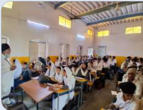
ਕੇਂਦਰ ਨਵਾਂਸ਼ਹਿਰ ਵੱਲੋਂ ਸਰਕਾਰੀ ਹਾਈ ਸਕੂਲ ਜਾਡਲਾ ਵਿਖੇ ਗੁਰਮਤਿ ਕੈਂਪ ਲਗਾਇਆ ਗਿਆ