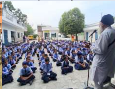
ਕੇਂਦਰ ਨਵਾਂਸ਼ਹਿਰ ਵੱਲੋਂ ਸੰਤ ਬਾਬਾ ਖੇਮ ਸਿੰਘ ਪਬਲਿਕ ਸਕੂਲ ਅਲਾਚੌਰ ਵਿਖੇ ਗੁਰਮਤਿ ਕੈਂਪ ਲਗਾਇਆ ਗਿਆ