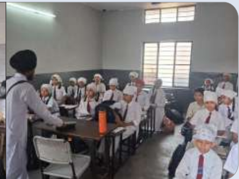
ਕੇਂਦਰ ਨਵਾਂਸ਼ਹਿਰ ਵੱਲੋਂ ਆਦਰਸ਼ ਬਾਲ ਵਿਦਿਆਲਿਆ ਸਕੂਲ, ਰਾਹੋਂ ਵਿਖੇ ਗੁਰਮਤਿ ਕੈਂਪ ਲਗਾਇਆ ਗਿਆ।