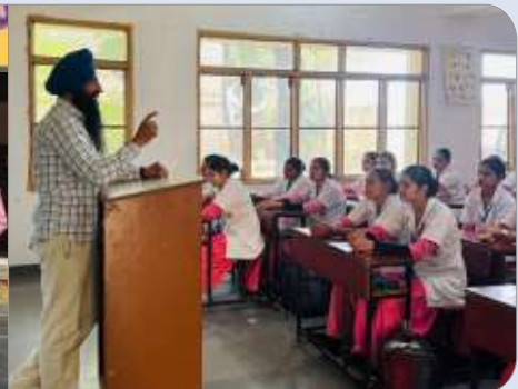
ਕੇਂਦਰ ਨਾਰੰਗਵਾਲ ਵਲੋਂ ਨਰਸਿੰਗ ਕਾਲਜ ਦਾਖਾ ਵਿਖੇ ਲੱਗ ਰਹੀ ਵਿਦਿਆਰਥਣਾਂ ਦੀ ਗੁਰਮਤਿ ਕਲਾਸ।