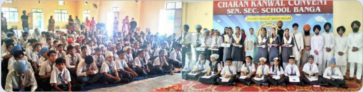
ਕੇਂਦਰ ਨਵਾਂਸ਼ਹਿਰ ਵੱਲੋਂ ਚਰਨ ਕਮਲ ਕਾਨਵੈਂਟ ਸਕੂਲ ਬੰਗਾ ਵਿਖੇ ਚਾਰ ਦਿਨਾਂ ਦਾ ਗੁਰਮਤਿ ਕੈਂਪ ਲਗਾਇਆ ਗਿਆ, ਉਪਰੰਤ ਬੱਚਿਆਂ ਨੂੰ ਸਨਮਾਨਤ ਕੀਤਾ ਗਿਆ