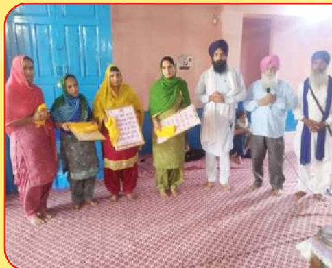
ਕੇਂਦਰ ਔਪਰਾ ਵਿਖੇ ਚਾਰ ਪਰਿਵਾਰਾਂ ਵਲੋਂ ਸਹਿਜ ਪਾਠ ਦੇ ਭੋਗ ਪਾਉਣ ਉਪਰੰਤ ਉਨ੍ਹਾਂ ਨੂੰ ਸਨਮਾਨਤ ਕੀਤਾ ਗਿਆ।