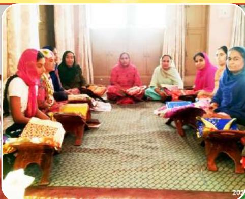
ਕੇਂਦਰ ਘਨੌਲੀ ਦੇ ਵੱਖ ਵੱਖ ਪਿੰਡ ਵਿਚ ਸਹਿਜ ਪਾਠ ਕਰ ਰਹੀਆਂ ਬੀਬੀਆਂ।