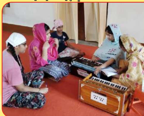
ਕੇਂਦਰ ਚੱਕ ਸਿੰਘਾ ਵਿਖੇ ਲੱਗ ਰਹੀ ਬੱਚਿਆਂ ਦੀ ਗੁਰਬਾਣੀ ਕੀਰਤਨ ਕਲਾਸ।