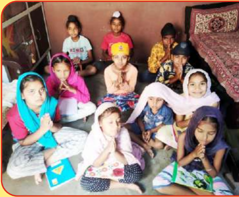
ਕੇਂਦਰ ਪਟਿਆਲਾ ਦੇ ਫਤਹਿਗੜ੍ਹ ਸਾਹਿਬ ਵਿਖੇ ਲੱਗ ਰਹੀ ਬੱਚਿਆਂ ਗੁਰਮਤਿ ਕਲਾਸ।