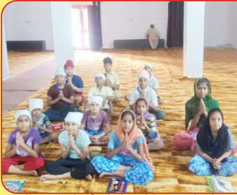
ਕੇਂਦਰ ਕੁੱਬਾ ਦੇ ਪਿੰਡ ਪ੍ਰਿਥੀਪੁਰ ਵਿਖੇ ਲੱਗ ਰਹੀ ਬੱਚਿਆਂ ਦੀ ਗੁਰਮਤਿ ਕਲਾਸ।