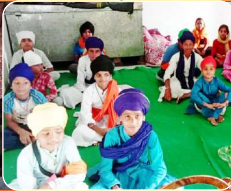
ਪਿੰਡ ਸੁਰਸਿੰਘ ਵਿਖੇ ਲੱਗ ਰਹੀ ਬੱਚਿਆਂ ਦੀ ਗੁਰਮਤਿ ਕਲਾਸ।