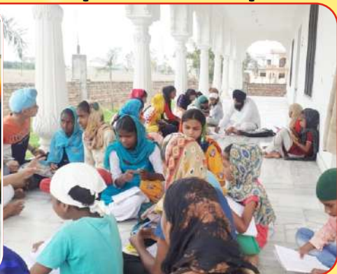
ਕੇਂਦਰ ਤਰਨਤਾਰਨ ਦੇ ਪਿੰਡ ਰੂੜੋਆਸਲ ਵਿਖੇ ਲੱਗ ਰਹੀ ਬੱਚਿਆਂ ਦੀ ਪਾਰਮਿਕ ਕਲਾਸ।