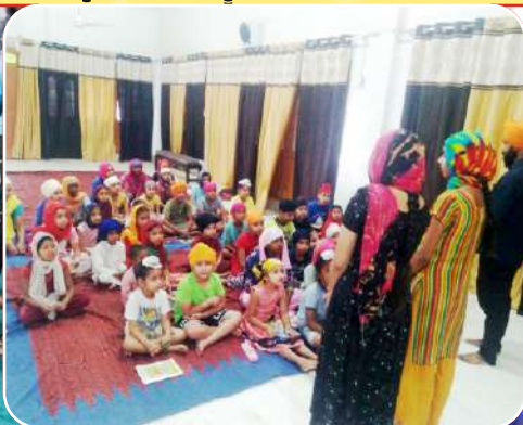
ਕੇਂਦਰ ਨਵਾਂਸ਼ਹਿਰ ਦੇ ਪਿੰਡ ਮਾਜਰੀ ਵਿਖੇ ਬੱਚਿਆਂ ਦੀ ਲੱਗ ਰਹੀ ਗੁਰਮਤਿ ਕਲਾਸ।