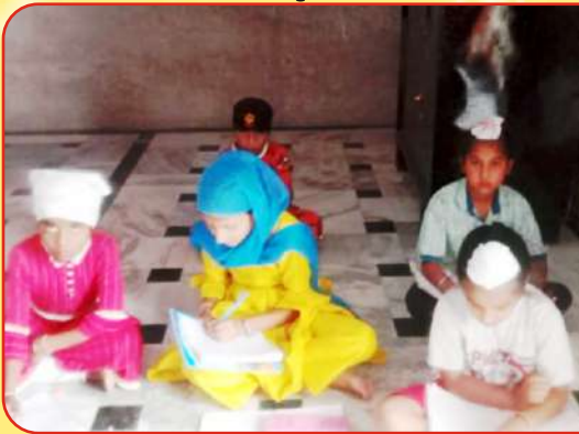
ਕੇਂਦਰ ਚੋਹਲਾ ਸਾਹਿਬ ਵਿਖੇ ਲੱਗ ਰਹੀ ਬੱਚਿਆਂ ਦੀ ਧਾਰਮਿਕ ਕਲਾਸ।