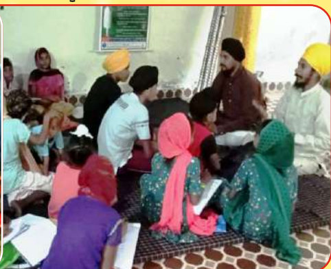
ਕੇਂਦਰ ਡੱਲੂ ਦੇ ਪਿੰਡ ਬੀਰਮ ਵਿਖੇ ਲੱਗ ਰਹੀ ਬੱਚਿਆਂ ਦੀ ਪਾਰਮਿਕ ਕਲਾਸ।