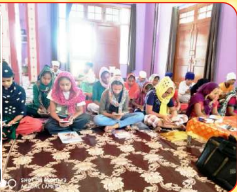
ਕੇਂਦਰ ਚੱਕ ਫੁੱਲੂ ਦੇ ਪਿੰਡ ਪਨਾਮ ਵਿਖੇ ਬੱਚਿਆਂ ਦਾ ਗੁਰਮਤਿ ਕੈਂਪ ਲਗਾਇਆ ਗਿਆ।