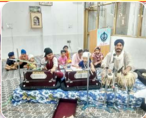
ਕੇਂਦਰ ਚੱਕ ਕਲਾਂ ਦੇ ਬੱਚੇ ਗੁਰਬਾਣੀ ਕੀਰਤਨ ਕਰਦੇ ਹੋਏ।