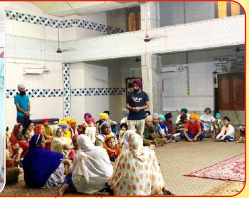
ਕੇਂਦਰ ਰਾਮੂਵਾਲਾ ਦੇ ਪਿੰਡ ਡਾਲਾ ਦੇ ਗੁਰਦੁਆਰਾ ਸਾਹਿਬ ਵਿਖੇ ਲੱਗ ਰਹੀ ਸੰਗਤ ਦੀ ਗੁਰਬਾਣੀ ਸੰਬੰਧੀ ਕਲਾਸ।