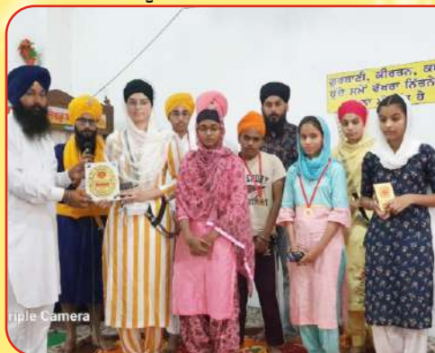
ਕੇਂਦਰ ਸਰਹਾਲੀ ਵਿਖੇ ਗੁਰਮਤਿ ਕੈਂਪ ਲਗਾਇਆ ਗਿਆ ਉਪਰੰਤ ਬੱਚਿਆਂ ਨੂੰ ਸਨਮਾਨਤ ਕੀਤਾ ਗਿਆ।