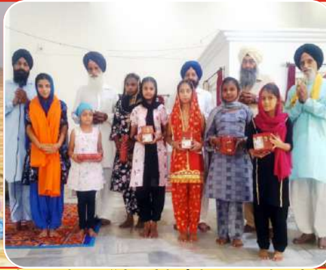
ਕੇਂਦਰ ਕਾਲੇਵਾਲ ਲੱਲੀਆਂ ਵਿਖੇ ਪੰਜਵੇਂ ਪਾਤਸ਼ਾਹ ਦੇ ਸ਼ਹੀਦੀ ਗੁਰਪੁਰਬ ਉਪਰੰਤ ਬੱਚਿਆਂ ਨੂੰ ਸਨਮਾਨਤ ਕੀਤਾ ਗਿਆ।