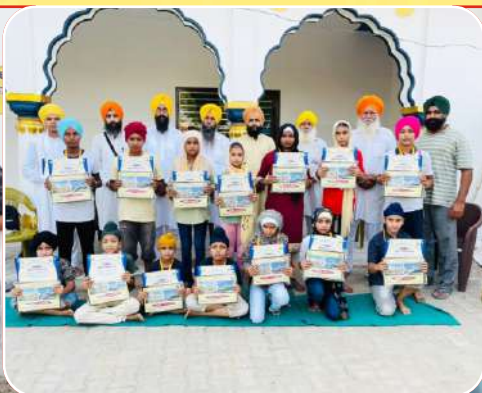
ਕੇਂਦਰ ਖਨਾਲ ਖੁਰਦ ਵਿਖੇ ਬੱਚਿਆਂ ਦੇ ਲਏ ਪਾਰਮਿਕ ਪੇਪਰ ਉਪਰੰਤ ਬੱਚਿਆਂ ਨੂੰ ਸਨਮਾਨਤ ਕੀਤਾ ਗਿਆ।